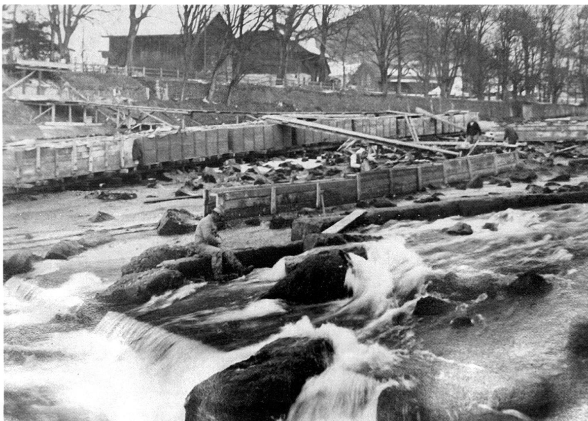
Abb. 3 Bauarbeiten an der Aaresohle im Schwäbis, zwischen 1916 und 1926. Wegen der Rückwärtserosion der Aare nach der Aare-Zulg-Korrektion musste im Schwäbis die Flusssohle ab 1877 in mehreren Etappen mit Steinblöcken gesichert werden. Damals entstanden die Aarefälle. Zu Beginn der 1960er-Jahre verschwanden diese im Rückstau des Wehrs, das damals für den Betrieb des neuen Elektrizitätswerkes errichtet wurde.

konnte die Unterspülung der Ufer zwar vermindert, aber nicht ganz gestoppt werden. Die Folgen dieser Gewässerkorrektion sind heute im Schwäbis eindrücklich sichtbar. Während die Aare vor der Korrektion noch gemächlich, mit wenig Gefälle und in weitem Bogen durch das Schwäbis Bern zufluss, stürzt das Wasser heute beim Stauwehr des Elektrizitätswerks rund sieben Meter in die Tiefe. 16