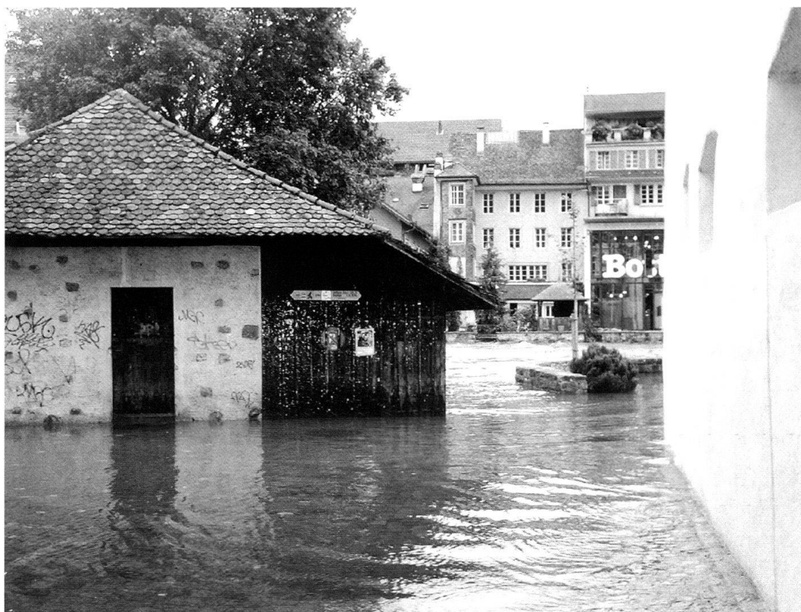
Abb. 2 Im Sommer 2005 stand Thun ein weiteres Mal unter Wasser. Der Wanderweg, der am alten Waschhaus beim Rathaus vorbeiführt, verwandelte sich in einen Wasserweg.