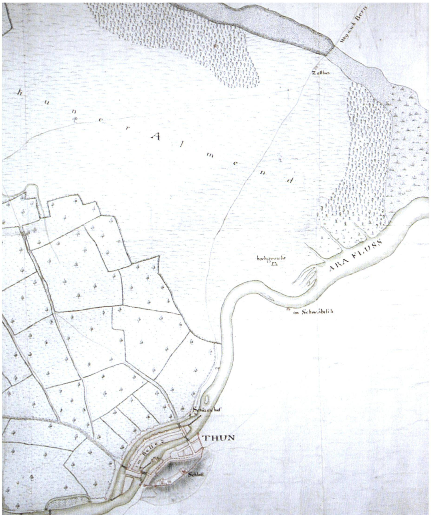
Abb. 2 Die um 1708 errichtete Hochgerichtsstätte der Landstadt Thun, 1716. Planaufnahme durch Ingenieur Johann Adam Riediger von 1716, drei Jahre nach der Kanderkorrektur. Der Galgen (Mitte rechts) stand aareabwärts Thun gegenüber auf einer kleinen Anhöhe zwischen der Aare und dem westlichen «Weg nach Bern», der am städtischen Zollhaus vorbei über die Kanderbrücke in die Thuner Spitalherrschaft Uetendorf-Uttigen (im Landgericht Seftigen) und über Gurzelen ins Gürbetal nach Bern führte. Der Thuner Galgen war das weithin sichtbare Hoheitszeichen der Stadt im Land- und Flussverkehr.