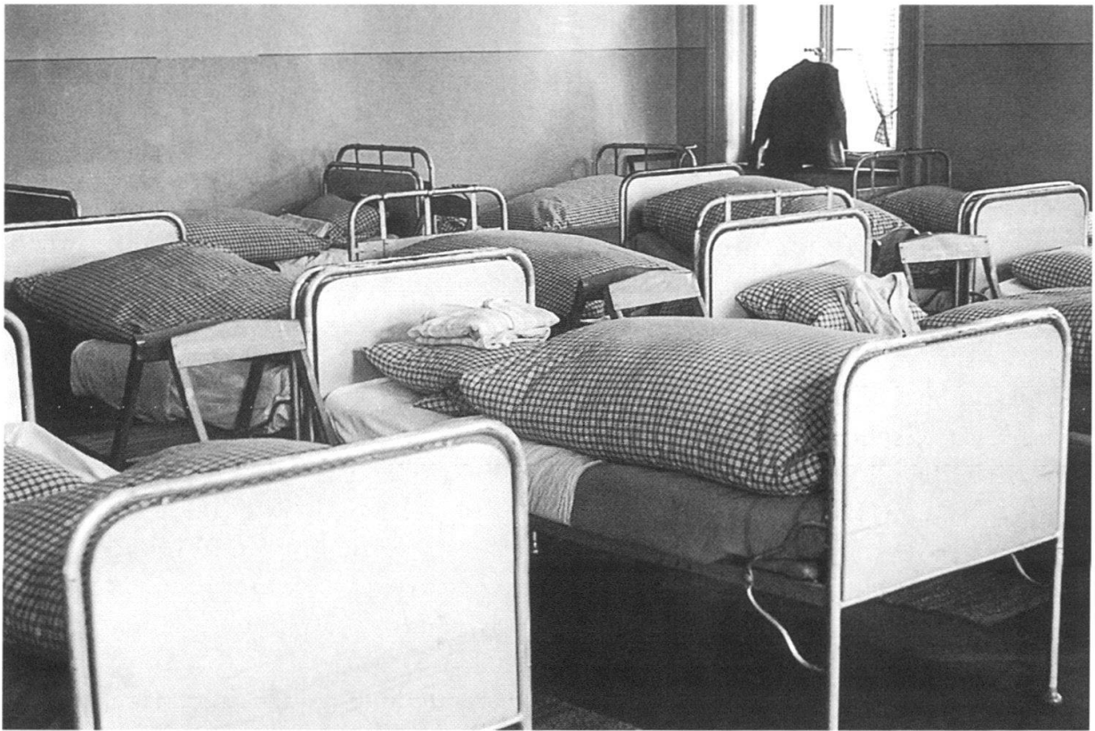
Die Schlafzimmer mit 16–18 Betten im Zöglingshaus von 1905, um 1955 (Staatsarchiv, BB13.3.1).

Ein anderer Friedrich hielt sich von 1903 bis 1909 in der Anstalt auf und ergriff nach Austritt den Beruf eines Hotelportiers, wo es ihm nicht immer gut ging. Offensichtlich war der Hausvater für ihn der ruhende Pol, wie einer Karte aus Grenchen vom März 1911 zu entnehmen ist: «Möchte Sie bitten mir zu erlauben am Sonntag zu ihnen herab zu kommen, damit ich mit Ihnen reden kann. Bin seit 14 Tagen hier in Grenchen als Portier im Dienst. Hoffe auf schnelle und gütige Antwort.» Er wurde dann vorübergehend wieder in die Anstalt aufgenommen. Später nahm er erneut eine Stelle als Portier an.