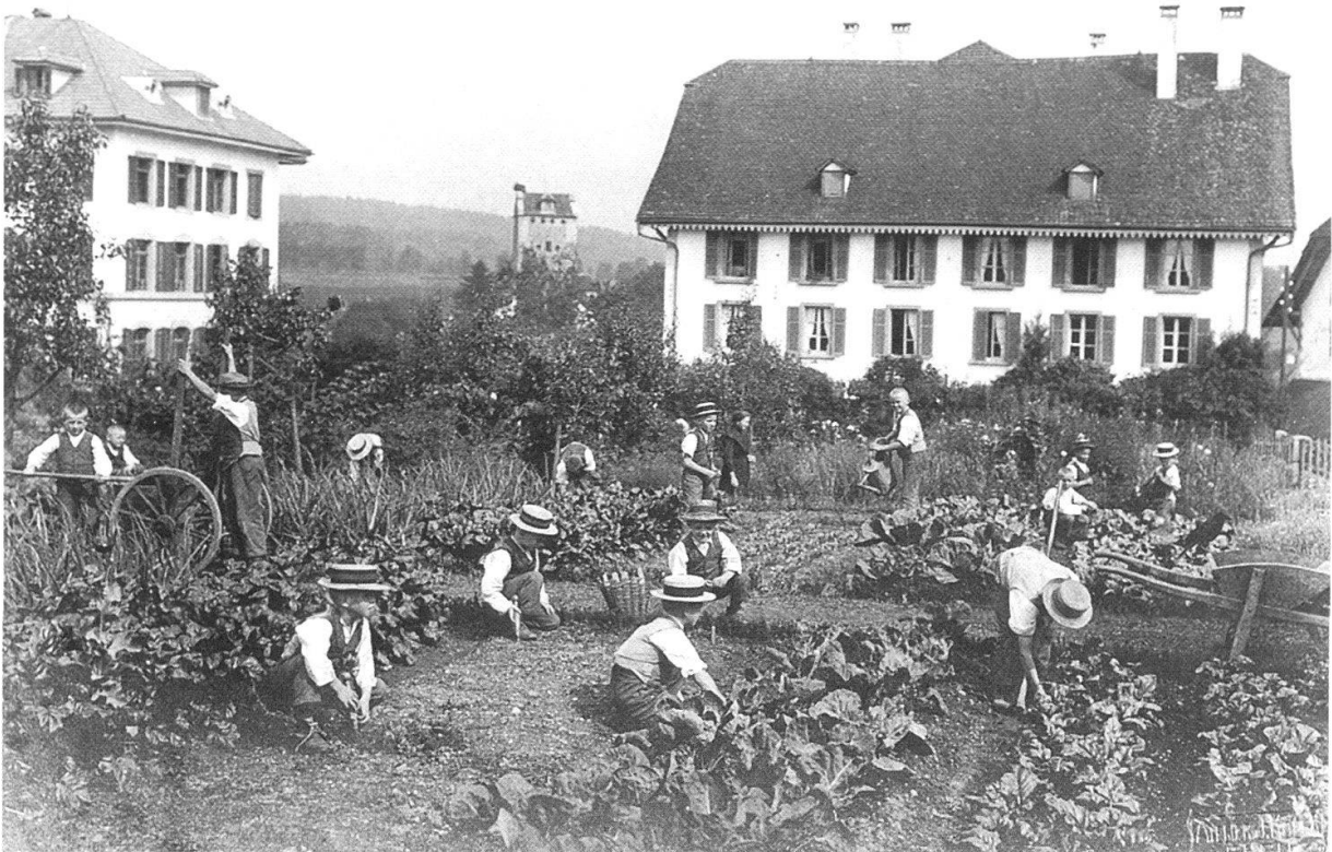
Gartenarbeit vor den Anstaltsgebäuden, um 1910