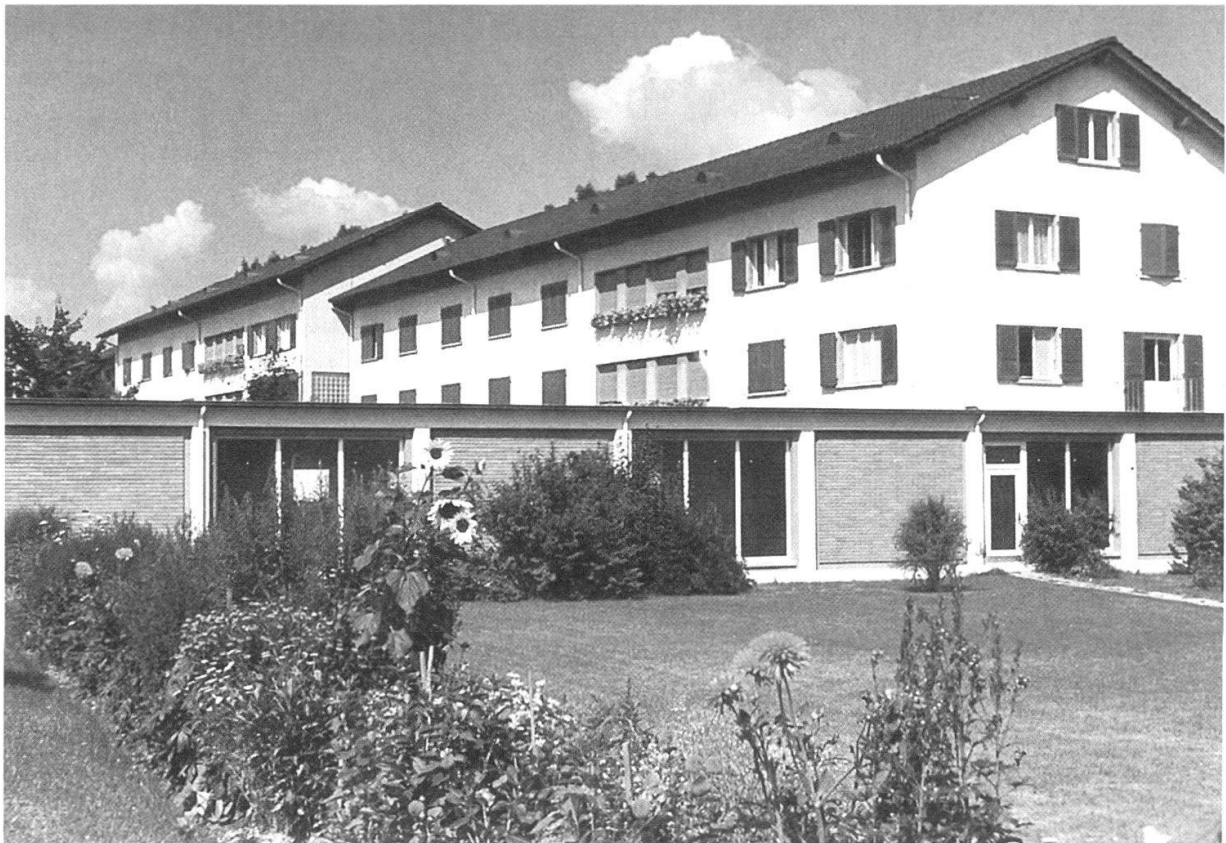
Die Knabenhäuser von 1965 mit dem Durchgang zum Schulhaus.

wurde, denn «eine zweite Rekrutenschule hätte er nicht überstanden»! Heute betreibt er eine eigene Werkstatt für die Restaurierung von antiken Möbeln.