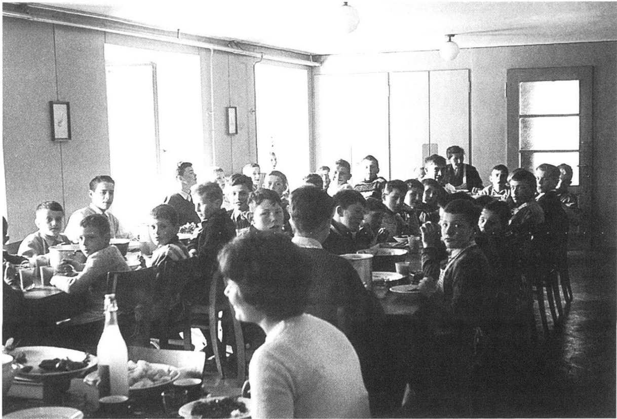
Der Speisesaal um 1955; die Hauselternfamilie sitzt am Tisch der Knaben (Staatsarchiv, BB13.3.1).

Leidensgeschichte. Nach seinem Austritt aus der Verpflegungsanstalt Worben blieb er bis 1942 bei einem Landwirt im Berner Oberland, wechselte nach Kappelen und 20 Monate später in die Schuhfabrik Bally nach Schönenwerd. Dort kostete ihn ein Missgeschick nach ungefähr einem Jahr die Stelle. Nach vielen Enttäuschungen und zahlreichen Stellenwechseln konnte er mit finanzieller Unterstützung einen Zuschneiderkurs besuchen. Leider war ihm als Schneider vorerst wenig Erfolg beschieden, denn innerhalb von vier Jahren war er in mindestens 30 Stellen tätig. Nach vielen Irrfahrten landete er 1950 in Bern, wo er auf eigene Rechnung zu arbeiten begann. 1951 ersuchte er den Hausvater um Geld für Anschaffungen für sein «Geschäftli». Ob er etwas erhalten hat, geht aus den Aufzeichnungen nicht hervor.