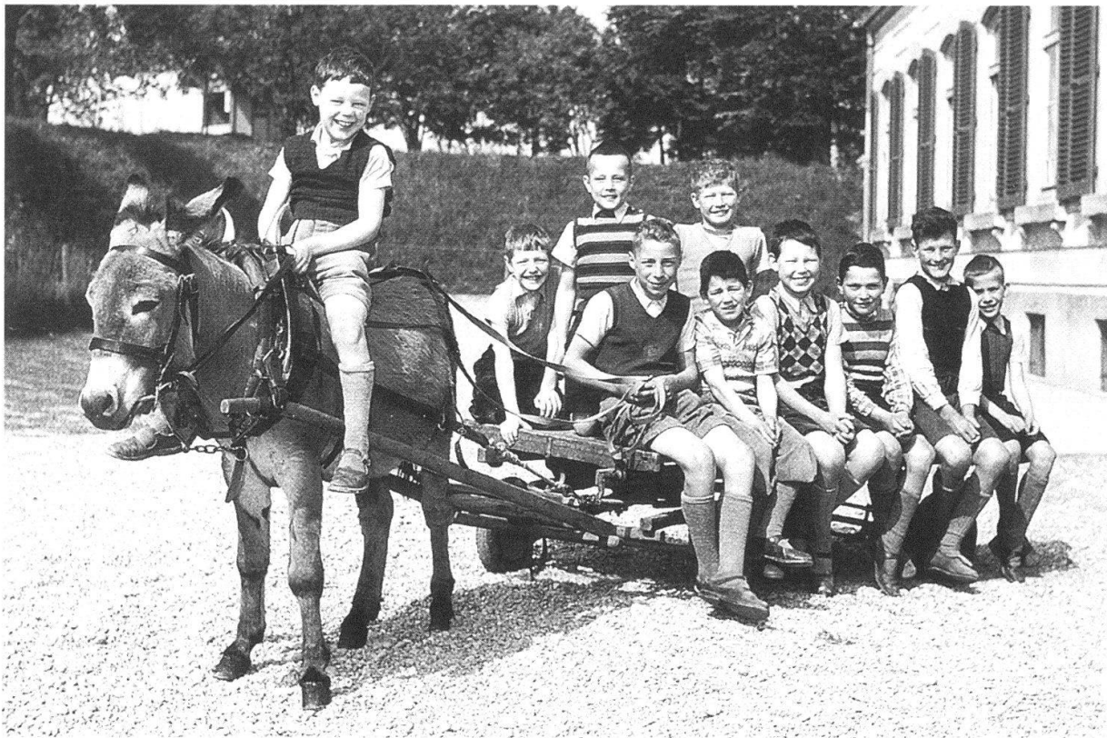
Ein Esel als treuer Diener und gutmütiger Spielkamerad, um 1970 (Photographie im Besitz der Familie Gfeller).

Zöglinge aufnahm. Sie konnte einen kleinen, von einem Esel gezogenen Wagen für Kinder anschaffen. Einem Knaben einer andern heilpädagogischen Familie soll das Erlernen eines Musikinstrumentes ermöglicht werden. Dem Schulheim Landorf bewilligte der Ausschuss einen namhaften Beitrag an die Erneuerung des Badeweiher, wobei die Hälfte davon mit den ordentlichen Beiträgen an das Heim verrechnet wird.