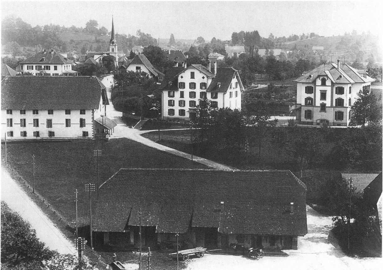
Die Gebäudegruppe der Knabenerziehungsanstalt Aarwangen um 1910 von Norden: links das alte Kornhaus, erbaut 1616/17, in der Bildmitte das 1762 errichtete neue Kornhaus, in dem 1863 die Anstalt eingerichtet wurde, rechts im Bild das neue Zöglingshaus von 1905; im Vordergrund die sogenannte «untere Scheune», die 1933 verkaufte ehemalige Schlossscheune.

Nach dem Zweiten Weltkrieg trat ein Wandel in der Einstellung der Bevölkerung zu Bildung und sozialen Werten ein, die sich stark auf die Unterbringung «versorgter» Kinder und auf die Vorstellung über die heimpädagogischen Tätigkeiten auswirkten. Die Schlafsäle mit ihren 16 bis 20 Betten und vor allem die aus dem Jahre 1905 stammenden hygienischen Einrichtungen gerieten unter den Beschuss der Versorger. In den Jahren 1957 bis 1959 erfolgte die Erarbeitung eines Konzeptes nach den damaligen neuesten Erkenntnissen. 16 Der dafür erforderliche Gesamtkredit von 2,6485 Millionen Franken stiess im Grossen Rat auf Widerstand und kam nur mit Stichentscheid des Präsidenten durch. Das Volk hingegen bewilligte den Kredit mit 52740 gegen 12617 Stimmen. 17 Der etappenweise Neu- und Umbau wurde in den Jahren 1960 bis 1964 ausgeführt und am 12. Oktober 1965 eingeweiht. Das Heim bot jetzt 66 Knaben Platz und war in den folgenden Jahren ausgelastet. Es handelte sich nun um keine Anstalt mehr, sondern um ein wohnliches Heim, in dem die kleinen Buben in Vierer-