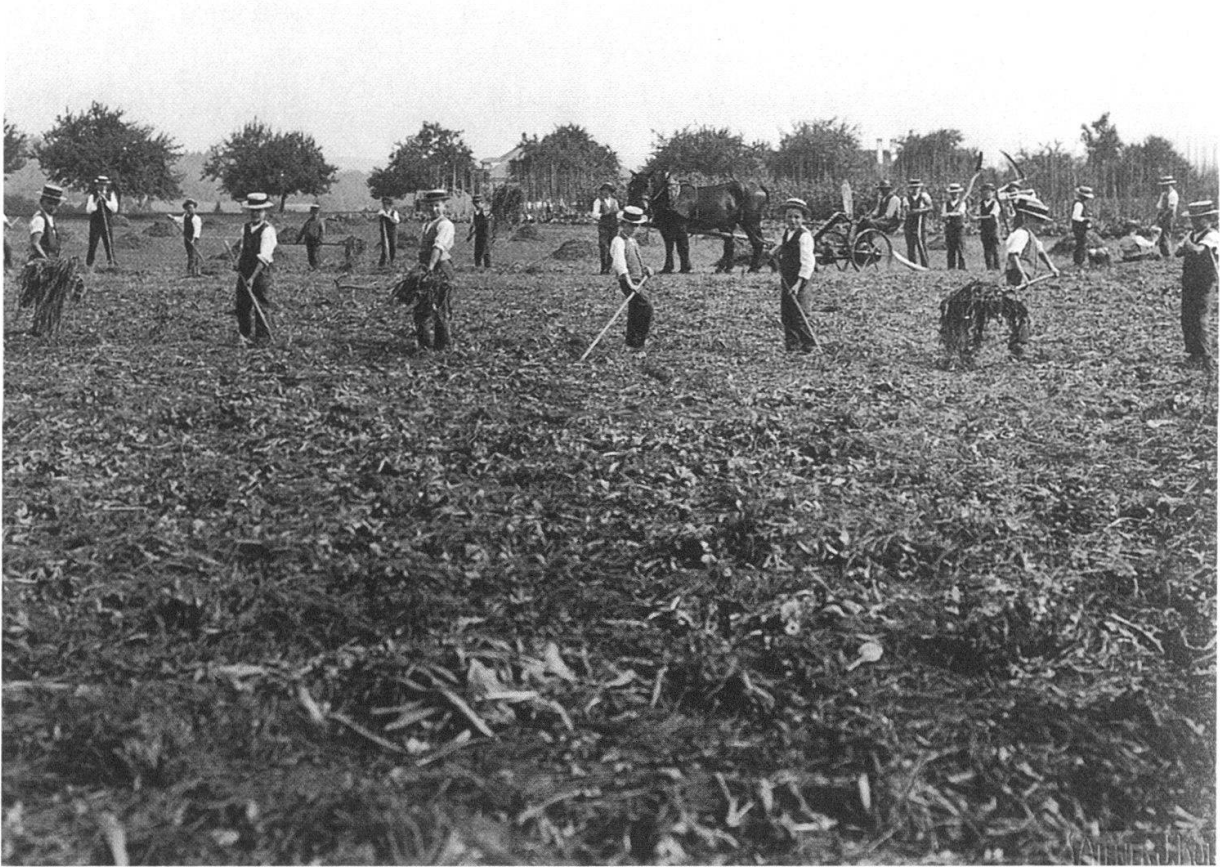
Die Zöglinge bei der Heuernte, um 1910.

Die vorstehenden, dem ersten Protokoll vom Juli 1864 entnommenen Angaben zeigen, was damals dem Vorsteher, den Lehrern und den Knaben zugemutet wurde. Doch schien der Betrieb problemlos zu funktionieren, denn in einem späteren undatierten Protokoll stellte die Aufsichtskommission fest, «dass die Landwirtschaft mit Sachkenntnis und Fleiss betrieben wird, ebenso die Arbeiten bezüglich der Garten- und sonstigen Anlagen».