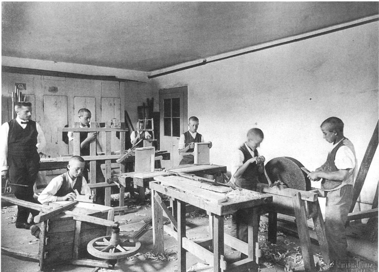
Die Zöglinge beim Handfertigkeitsunterricht, um 1910.

nichts wissen. Auch der Knabe befand sich wohlauf und hatte gemäss Bestätigung der Ärzte mit keinem Nachteil zu rechnen. 42