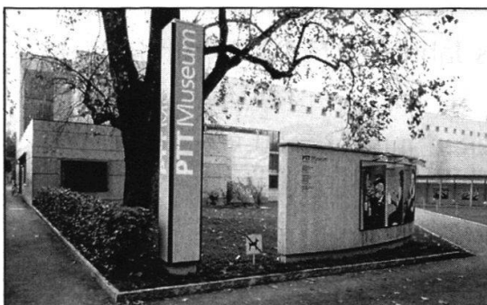
PTT-Museum, Helvetiastrasse 16 3000 Bern 6, Telefon 031 338 77 77