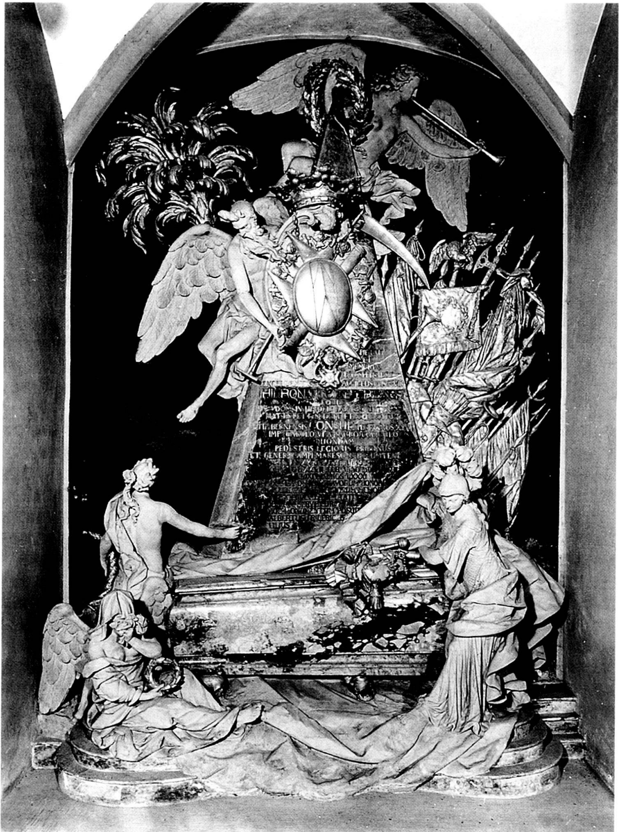
Abb. 2: Grabmal des Berner Schultheissen Hieronymus von Erlach von Johann August Nahl in der Kirche von Hindelbank (1751).