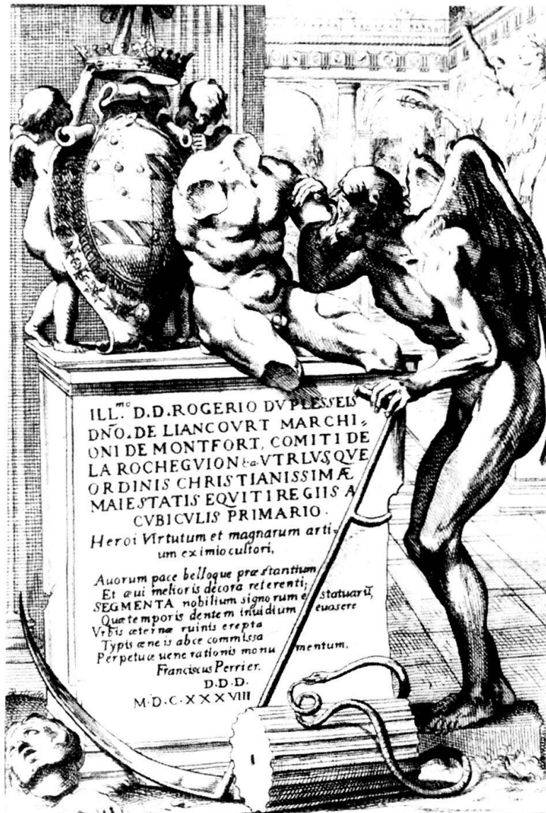
Abb. 11: Titelpuffer von «Les statues antiques de Rome» von François Perrier, Rom 1638.

Die künstlerische Reflexion über Natur und Kunst als antagonistische Kräfte hat zu inspirierten Bildfindungen geführt. Auf dem Titelpuffer von François Perriers Antikenpublikation «Les Statues antiques de Rome» (1638) nagt in einem ganz wörtlichen Sinn der Zahn der Zeit am Torso von Belvedere (Abb. 11). Die durch eine Chronos-Darstellung personifizierte Zeit ist im Begriff, eines der bedeutendsten Bildwerke überhaupt zu verzehren. 110 Auch im Langhansgrab wird gezeigt, wie Naturkräfte ein Kunstwerk zerstören. Entscheidend aber ist, dass bei der bildnerischen Umsetzung dieses Vorgangs auf eine Personifikation der Natur verzichtet werden konnte. Die Natur tritt nicht mehr in der personifizierten Gestalt eines Chronos und damit allegorisch gefiltert in Erscheinung. Sie wird durch einen scheinbar ungekünstelten Formnaturalismus wieder-