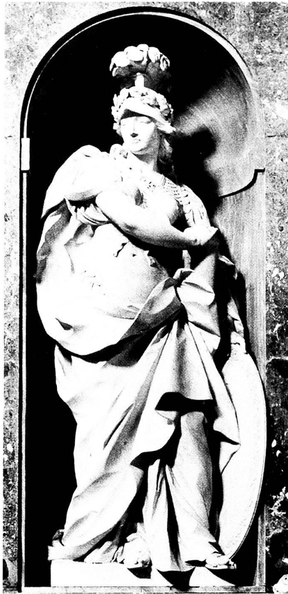
Abb. 5: Die «Fortitudo» von Giuseppe Rusconi in der Corsini-Kapelle von S. Giovanni in Laterano, Rom, (1734–1736).

zusammentreffen. Dieser Formeklektizismus ist für die gesamte Anlage des Monuments kennzeichnend.