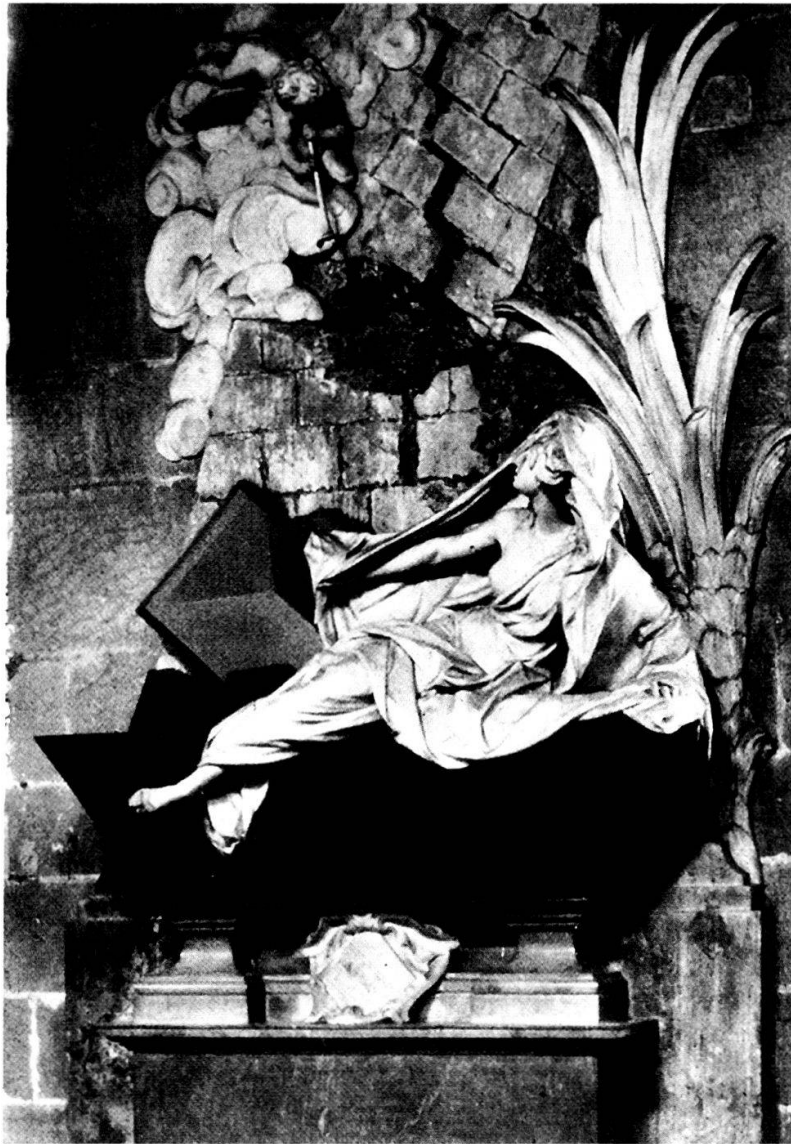
Abb. 9: Grabmal der Mary Myddleton von Louis-François Roubiliac in der Wrexham Church (1751).

des Langhansgrabmals gibt den eschatologischen Topos mit einer illusionistischen Nahsicht wieder, zu der ihn die Kenntnis literarischer Vorlagen allein nicht befähigen konnte. Auch lässt sich die auf den Augenblick zugespitzte bildnerische Umsetzung nicht nahtlos aus der ikonographischen Tradition der Auferstehungsszenen ableiten, die in Weltgerichtsdarstellungen der mittelalterlichen Kathedralplastik, aber auch in der Grabmalkunst selbst vorgeprägt sind. 88