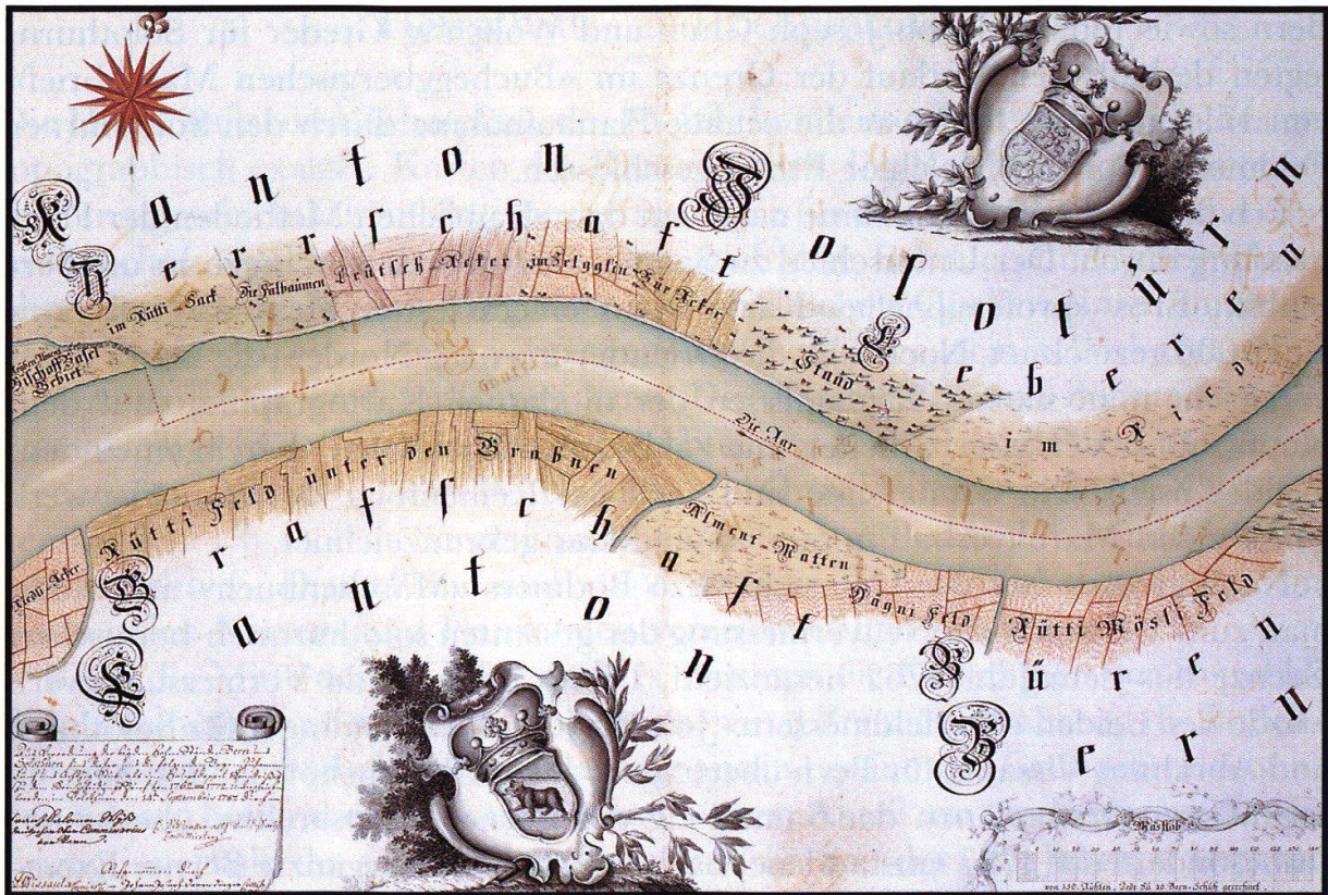
Erstes Blatt der Gesamt-Grenzvermarchung zwischen den Ständen Bern und Solothurn, 1762ff. Ausgeführt durch die Geometer Abraham Vissaula und Johann Joseph Derendinger. Nachgetragenes, ergänztes und visiertes Berner Exemplar von 1787 (Atlas Nr. 12).

Verglichen mit der Genauigkeit heutiger Karten, schneiden Bodmers Zeichnungen natürlich schlecht ab. Da Längen und Winkel meist nicht stimmen, ergeben sich auf seinen Karten riesige Verzerrungen. Manchmal zeichnet Bodmer den Grenzverlauf sogar im Spiegelbild, weil er bei der Feldaufnahme die Richtungsänderungen der Grenze nach rechts oder nach links nicht richtig notiert hat. Bodmers «Marchenbuch» deshalb zum «Märchenbuch» herabwürdigen zu wollen, wäre indessen falsch. Für eine Fülle von Details – Burgruinen, Brücken und Furten, ursprüngliche Flussläufe und so weiter – ist sein Werk die einzige noch vorhandene primäre Quelle.