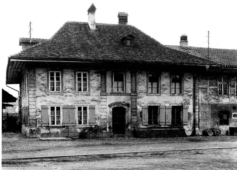
Die ehemalige Wirtschaft Weyermannshaus, Zustand um 1950.

beanstandet. Bauherr des Wirtshausbaues von 1751/52 ist Christoph (III) Steiger. Der Name des Architekten ist nicht bekannt; aufgrund Steigers Kontakten zu den führenden Berner Architekten der Zeit, aber auch aufgrund des architektonischen Ausdrucks des stattlichen zweigeschossigen Gebäudes mit geknicktem Vollwalmdach, darf der Erbauer im Kreis namhafter Architekten vermutet werden. Die Wirtschaft Weyermannshaus ging 1821 von der Familie Steiger in städtischen Besitz über; kurz nach 1900 dürfte das Wirtschaftsrecht eingegangen bzw. verlegt worden sein, 1908 schliesslich ging das ehemalige Wirtshaus wieder in private Hände über. Der ursprünglich allseitig freistehende Bau zeichnete sich durch die guten Proportionen und die sorgfältig gestalteten Details aus. Grösste Sorgfalt ging in die Planung und Ausführung der axialsymmetrischen fünfsichtigen Eingangsfront, mit dem in Sandstein ausgeführten Risalit zugleich repräsentative Schauseite. Von der Qualität des Gebäudes zeugte nicht zuletzt die im wesentlichen erhaltene Ausstattung. Das Gebäude wurde jedoch schon im ausgehenden 19. Jahrhundert, dann vor allem im Laufe des 20. Jahrhunderts nicht mehr unterhalten und zudem mehr und mehr in einer von Industriebauten geprägten Umgebung isoliert, so dass die Denkmalpflege darauf verzichtete, gegen den Abbruch und den Neubau eines