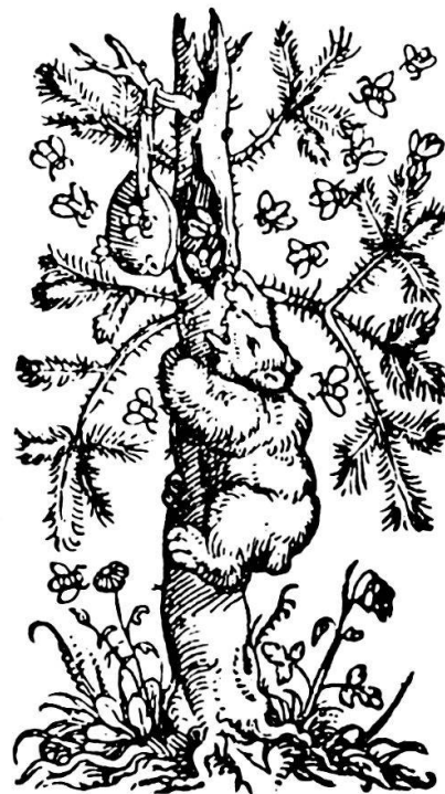
«Redende Druckstöcke»: Links Frosch(sch)auer in Zürich, aus dem «Stobaeus» von 1543; rechts Biener (Apiarius) in Bern (mit dem honigsuchenden Bären), aus dem ältesten Berner Druck, dem «Compendium musices» von 1537.