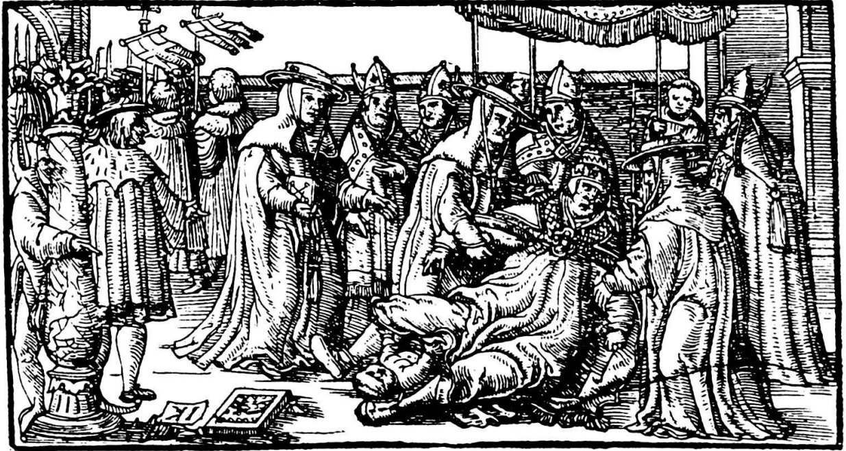
«De claris mulieribus» von Boccaccio mit den Holzschnitten von Jakob Kallenberg ist das erste illustrierte in Bern gedruckte Buch.

Einen besonderen Platz nehmen Boccaccios «Berühmte Frauen» ein, ein Novellenband, der 1539 als Druckerzeugnis des ersten Berner Druckers Mathias Apiarius erschien. Unser Berner Exemplar enthält auch den letzten, meist fehlenden der 15 Textholzschnitte mit der Niederkunft der Päpstin Johanna. Leimreste weisen darauf hin, dass die anstössige Doppelseite früher zusammengeklebt war. Damit stehen wir bereits im reformierten Bern, wo die Druckkunst mit in den Kampf gegen das Papsttum eingespannt wird, wo eine neue Hohe Schule mit einer Bibliothek entsteht.