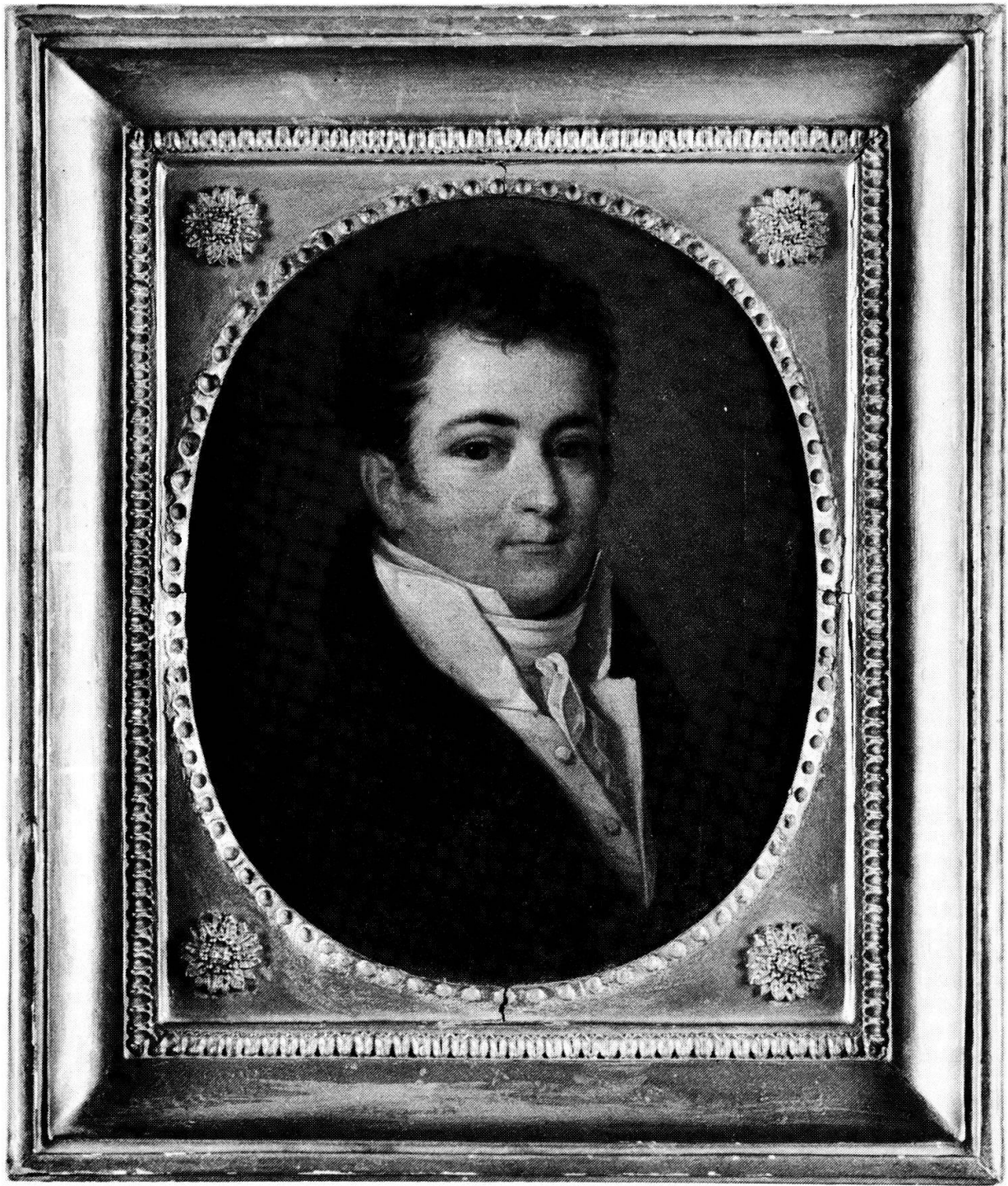
Georg Rudolf Simon (1784–1858)

Öl/Lw. 24,7 x 19,6 cm (oval) Pieter Recco (um 1765–1820), 1816 Privatbesitz