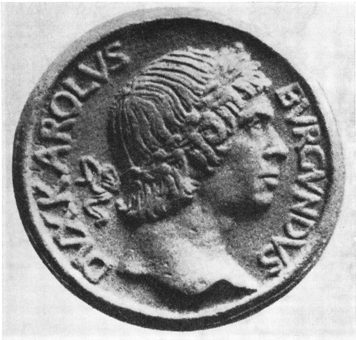
DVX KAROLVS BVRGVNDVS. Bildnismedaille des Giovanni Candida.

Aus glücklichen Jugendjahren stammt die Darbringungsminiatur der «Chroniques du Hainaut» in der königlichen Bibliothek in Brüssel. Mit dem Blick auf den dreizehnjährigen Grafen von Charolais – hier noch fast unter seinem Alter kindlich – gewährt sie Einblick in die Art der inneren und äußeren Formen am Hofe Philipps des Guten, des Vliesordengründers und «grand duc du ponant» , dessen Noblesse und leichte Gebärde wir hier wie wohl nirgends gewahren.