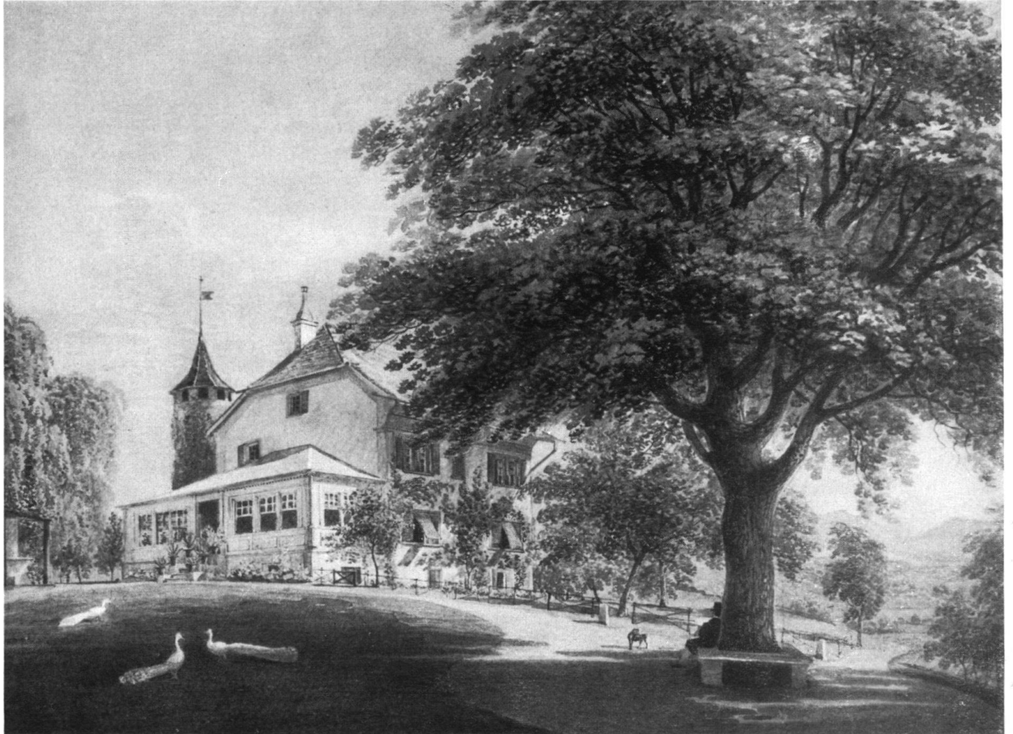
Das Schlöbli Jolimont um 1825 Aquarell von Gabriel Lory, Sohn; im Besitz der Familie de Pury