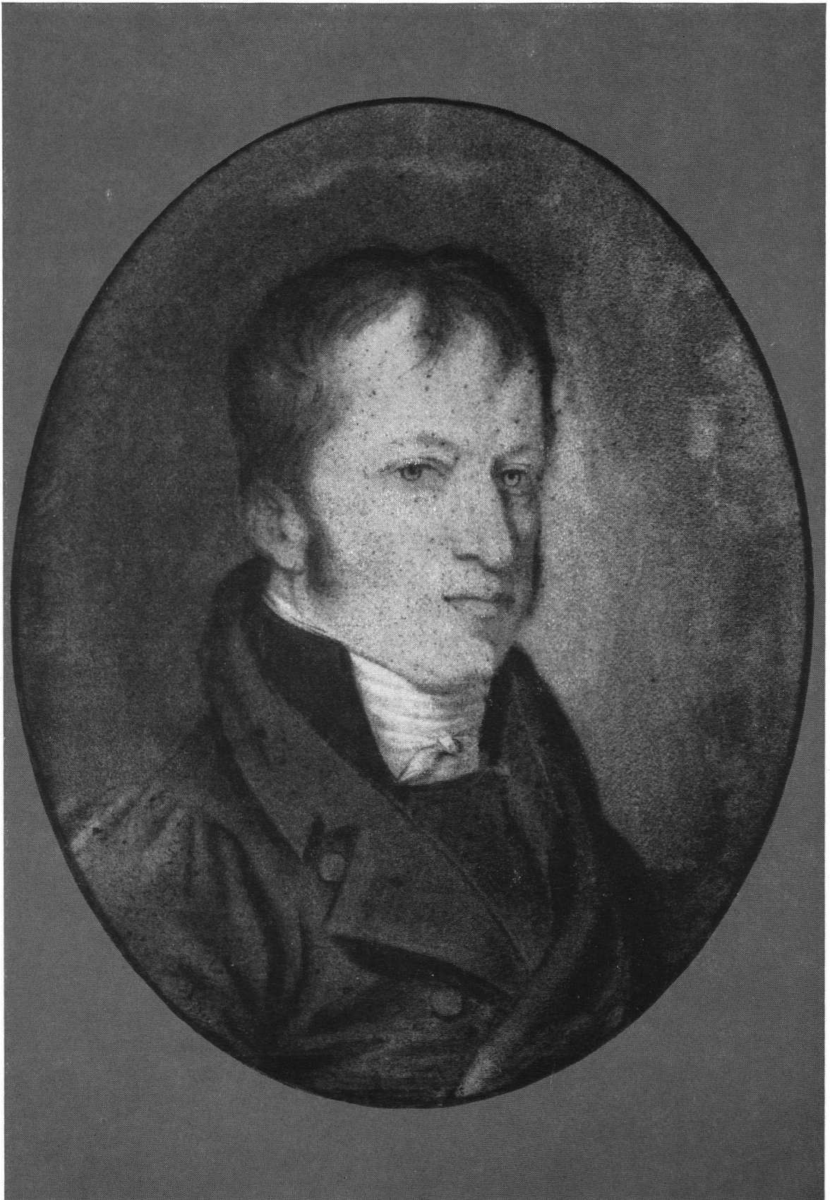
Philipp Emanuel von Fellenberg 1771 — 1844