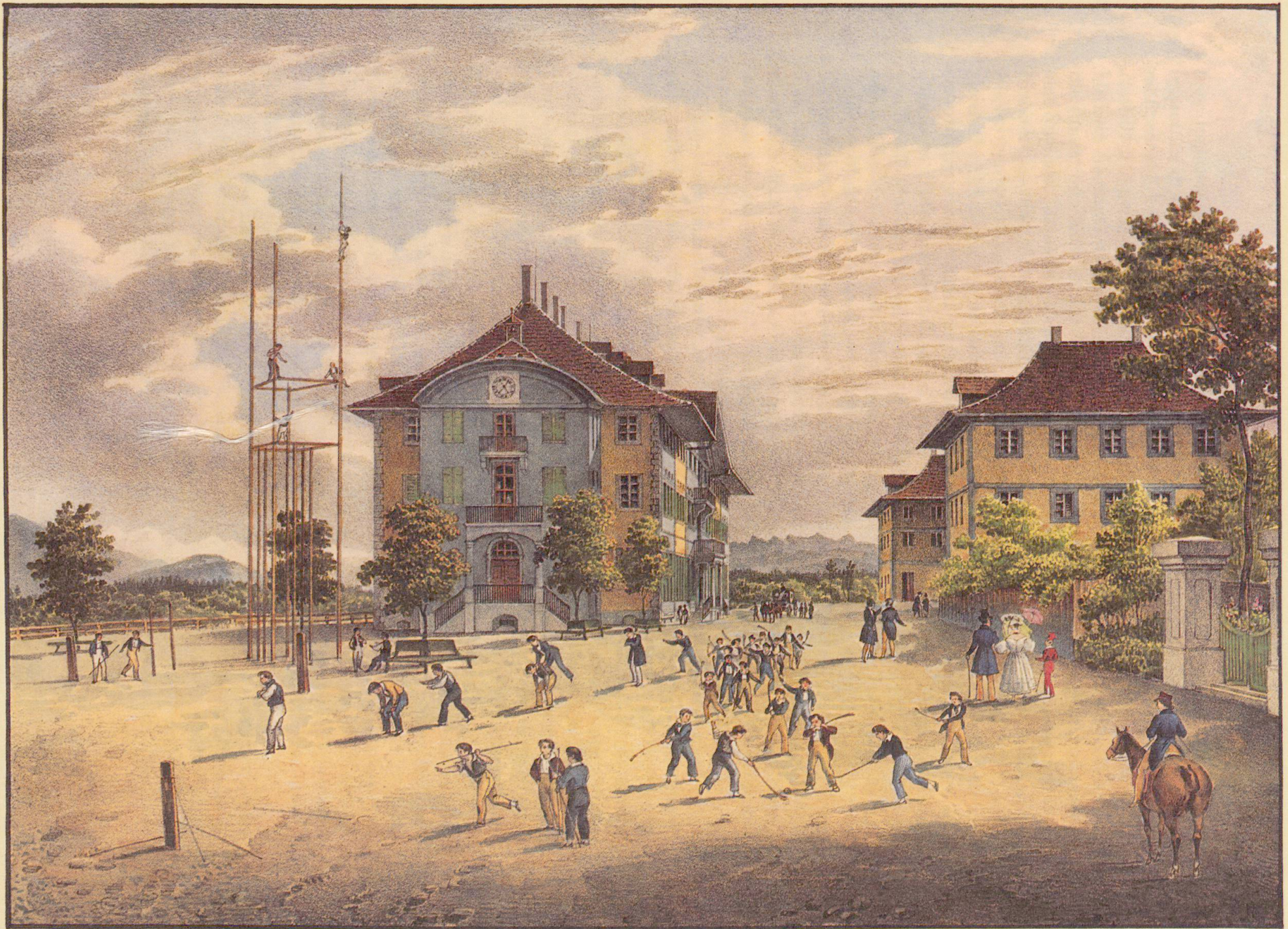
Das Große Haus in Hofwyl von der Nordseite