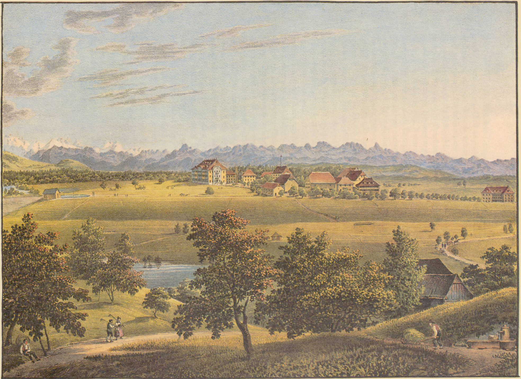
Übersicht von Hofstad (um 1830/40)