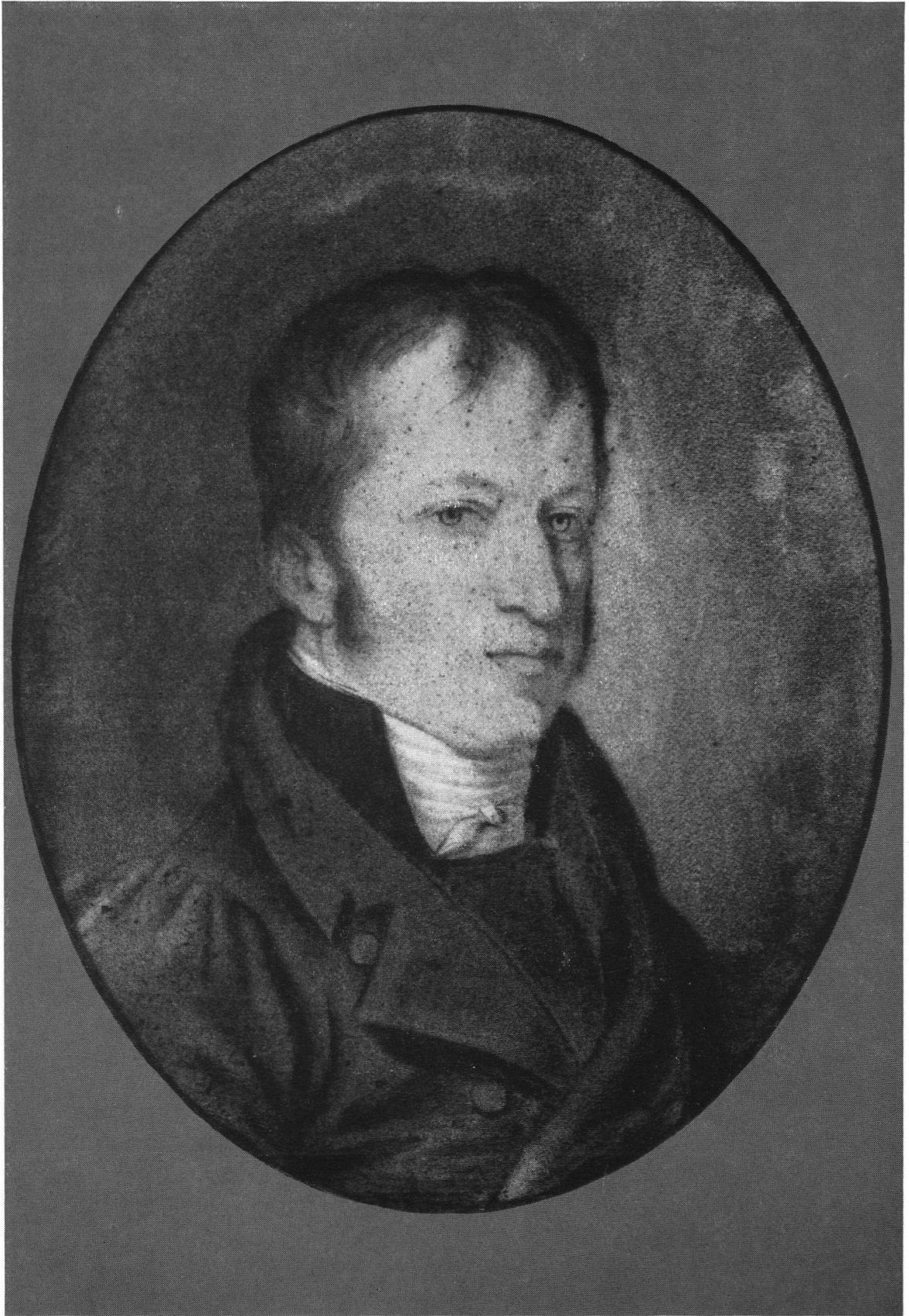
Philipp Emanuel von Fellenberg 1771 — 1844