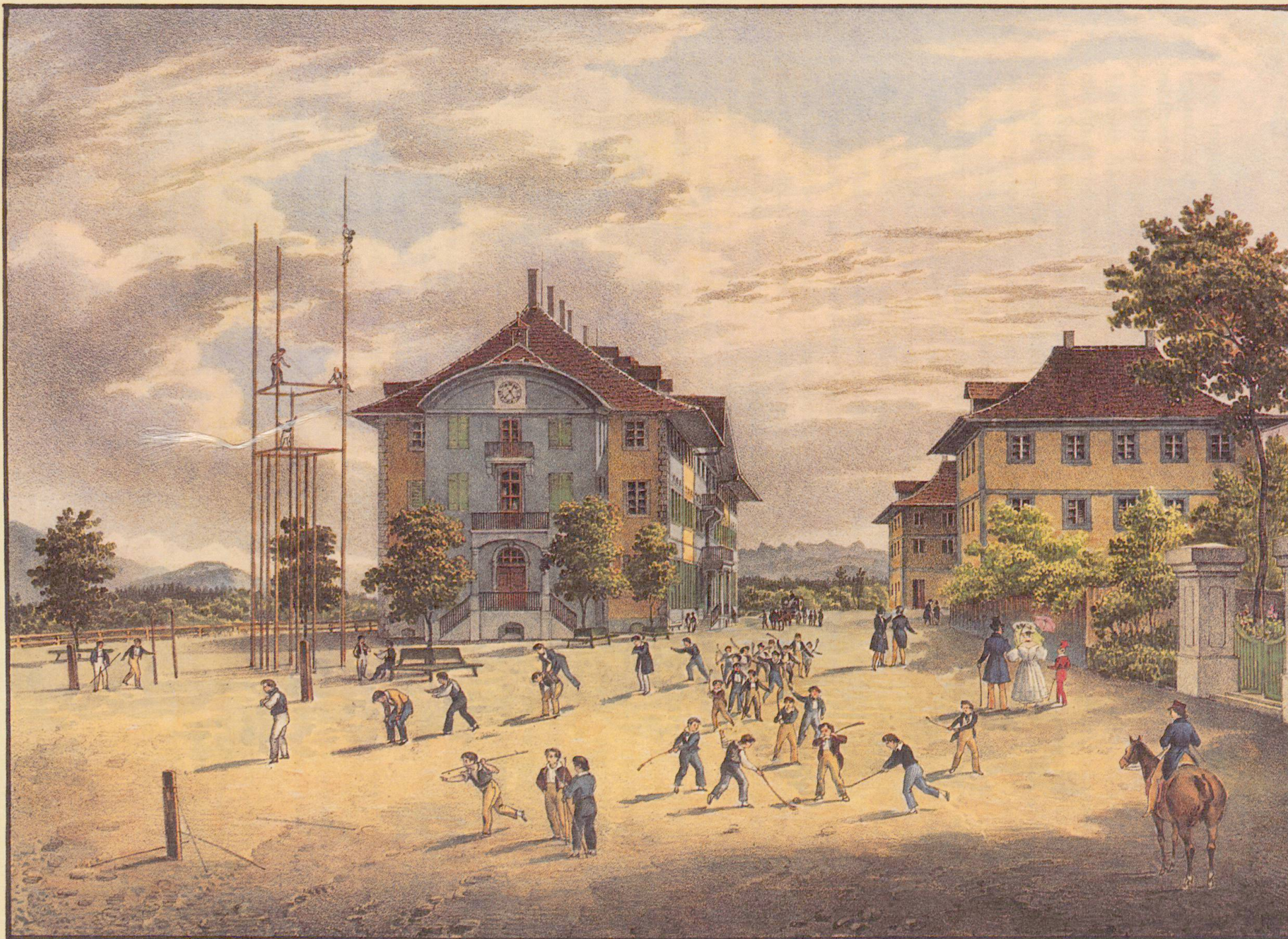
Das Große Haus in Hofwyl von der Nordseite