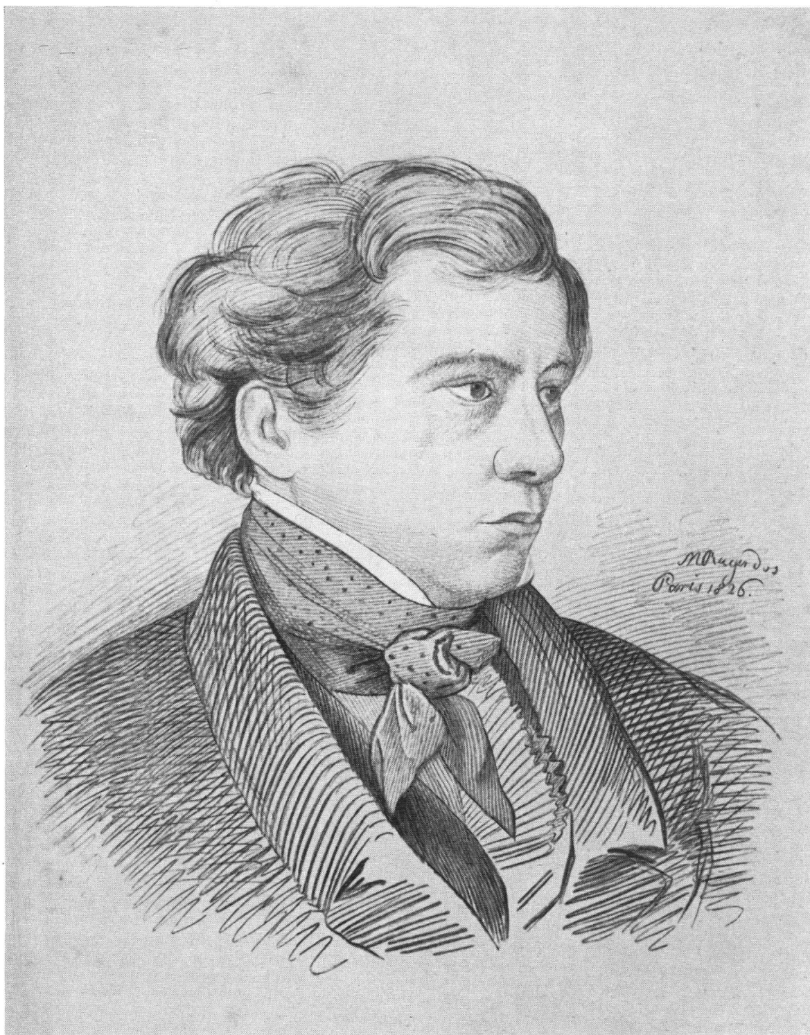
Victor Aimé Huber