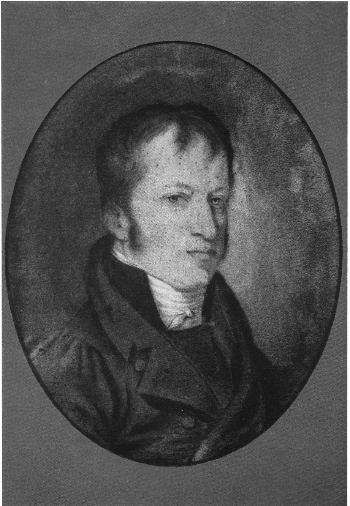
Philipp Emanuel von Fellenberg 1771 — 1844