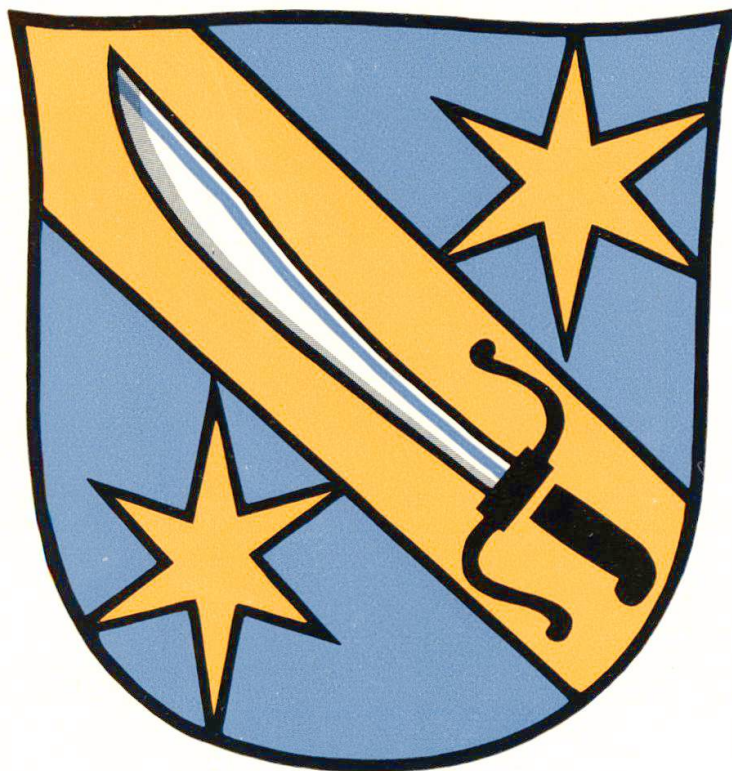
Wappen der Familie König (Roy) aus Orbe, in Bern eingeburgert 1574