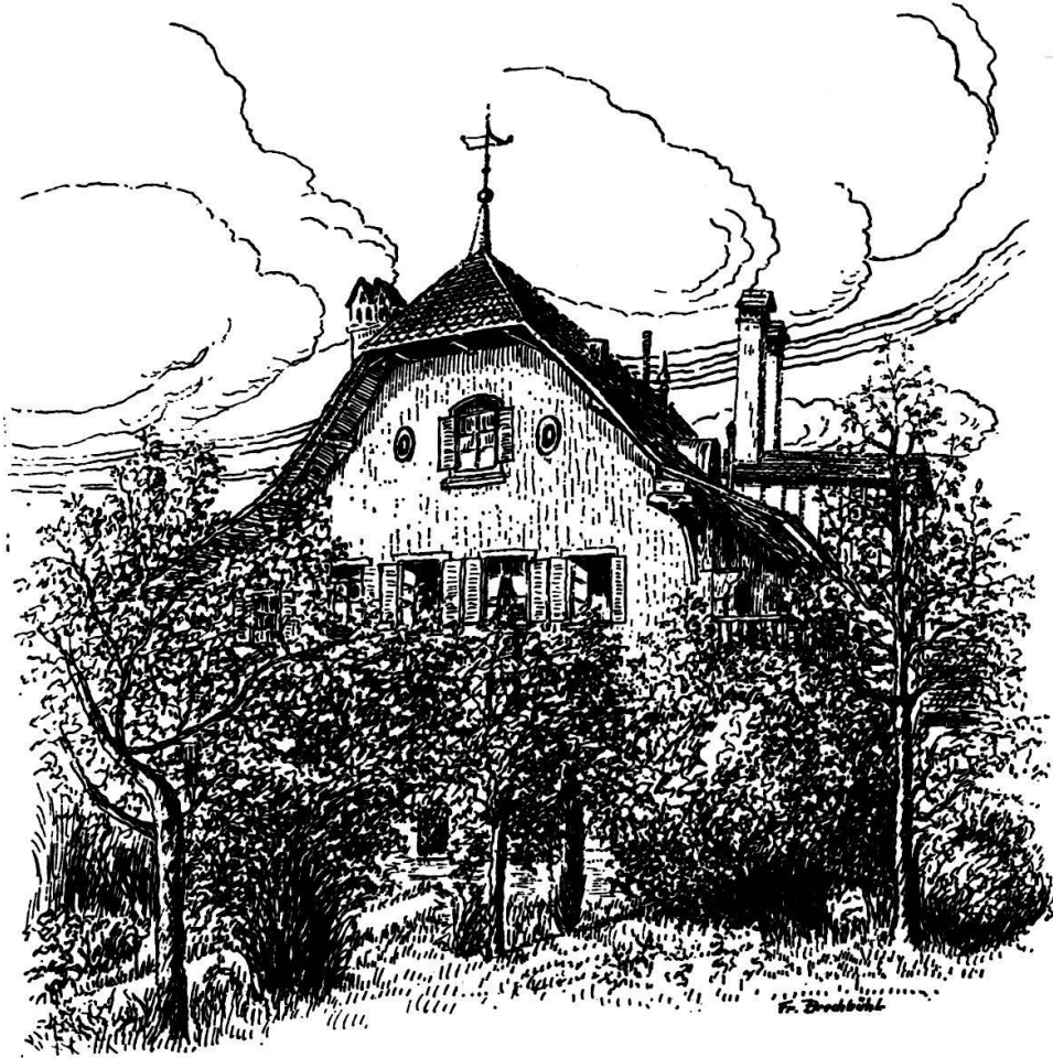
Weihergasse 17, Gartenseite

berkronen und seiner Ehefrau eine Sonnenkrone. Das ist zusammen etwa so viel wie 650 heutige Franken. — Zu dem 1596 erworbenen Wasser kamen später weitere Quellen, von denen noch die Rede sein wird.