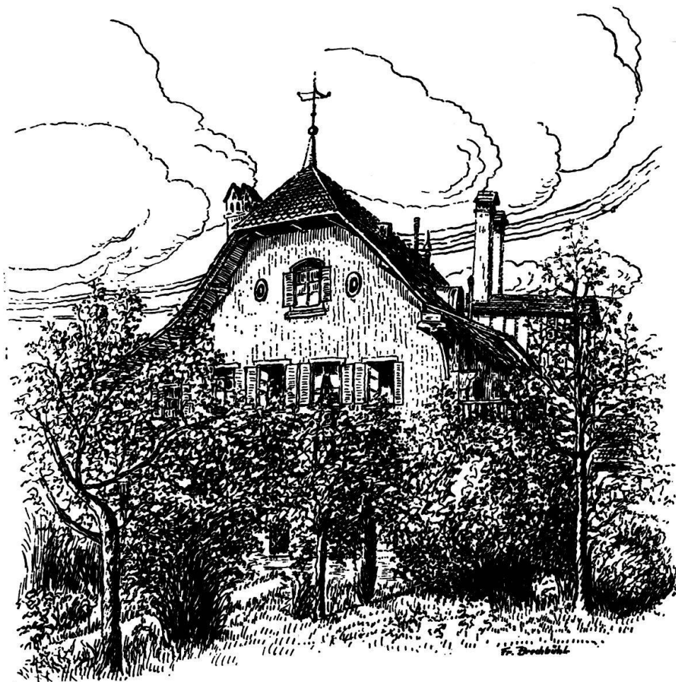
Weihergasse 17, Gartenseite

berkronen und seiner Ehefrau eine Sonnenkrone. Das ist zusammen etwa so viel wie 650 heutige Franken. — Zu dem 1596 erworbenen Wasser kamen später weitere Quellen, von denen noch die Rede sein wird.