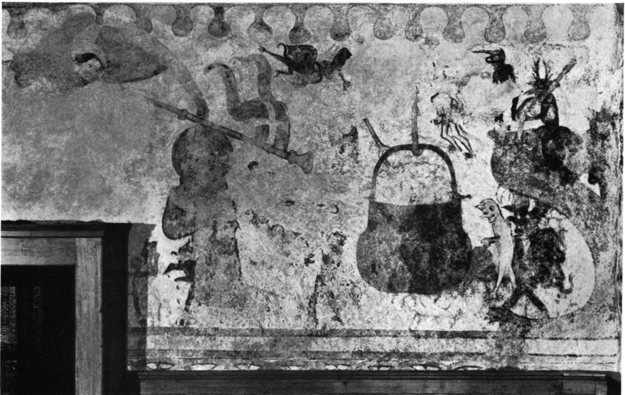
Tafel I: «Jüngstes Gericht», an der Westwand (Größe des Originals: 7×3 m).