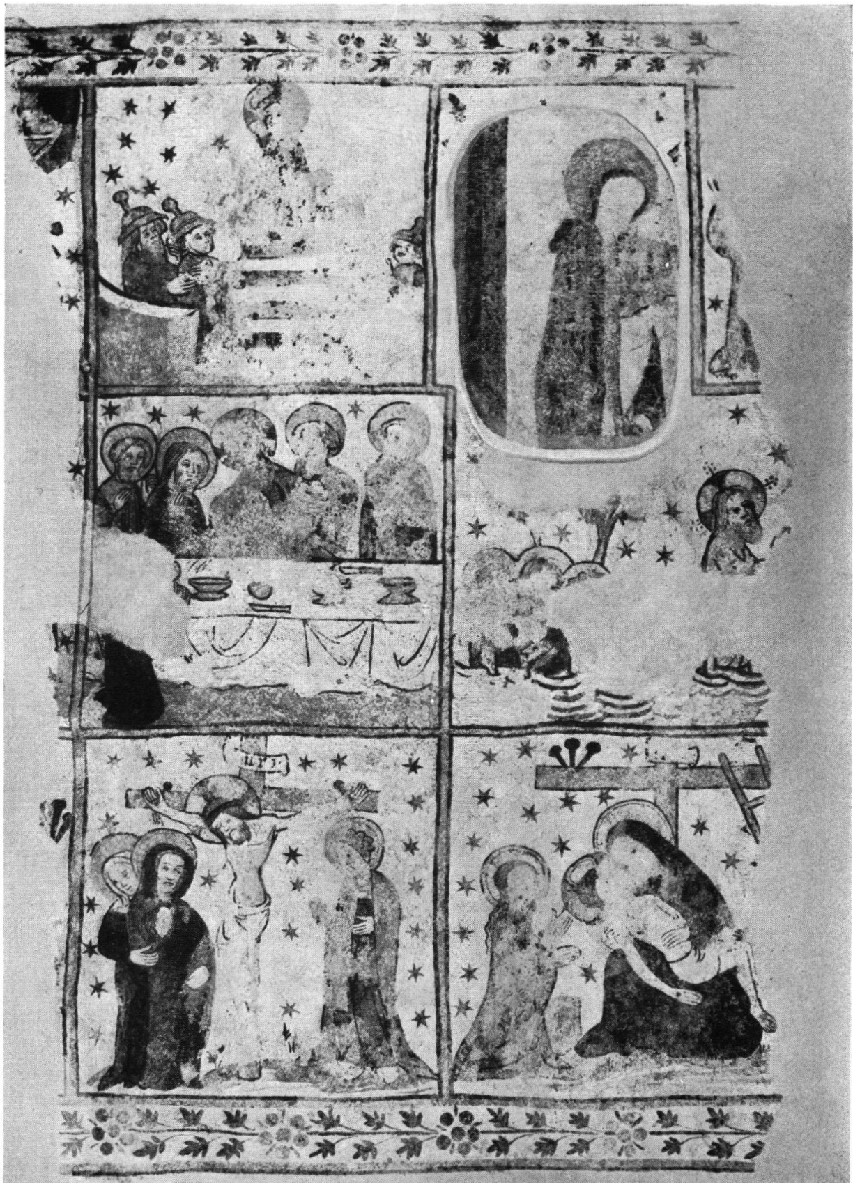
Tafel II. Bilder aus der Passion Christi (Südwand), einzelne Bilder ca. 80×84 bis 90×120 cm.