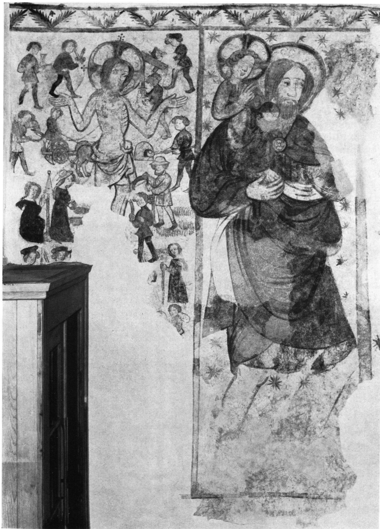
Tafel IV. «Feiertags-Christus» und «Christophorus»; rechte Chorscheidewand (150 × 360 cm).