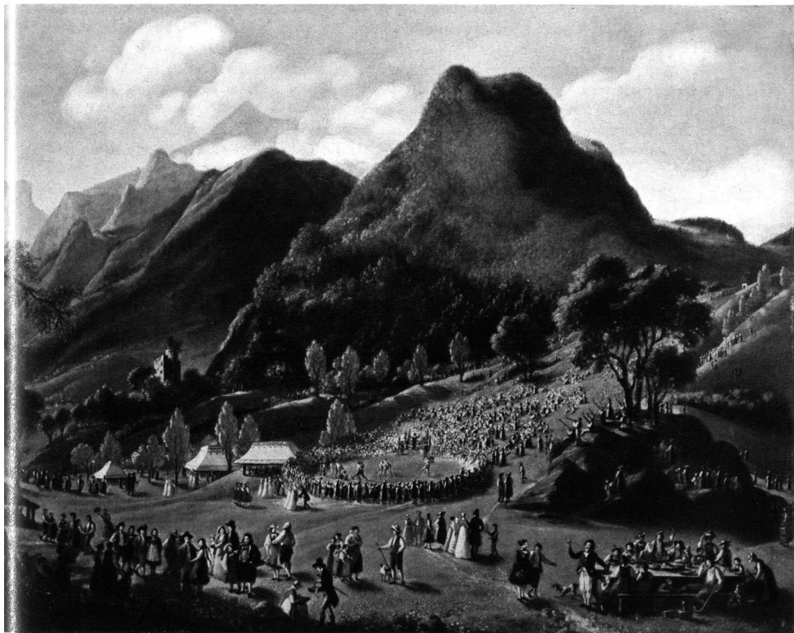
Das Alphirtenfest in Unspunnen 1808.