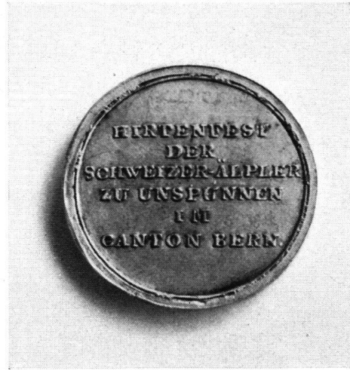
Medaille zur Auszeichnung der Sieger. Original im Historischen Museum Bern.