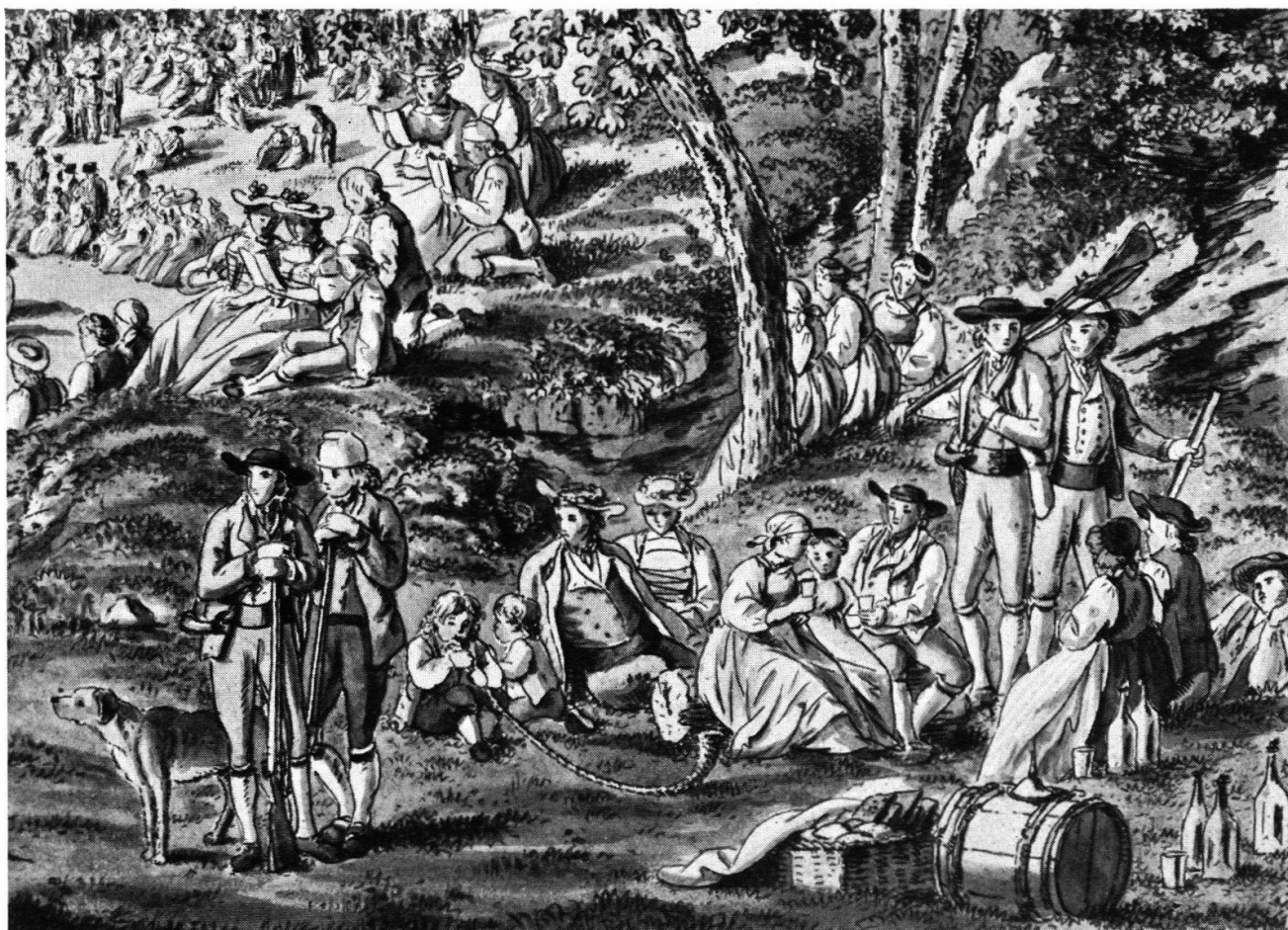
Bildausschnitt aus der Radierung von F.N. König: Schützengruppe.