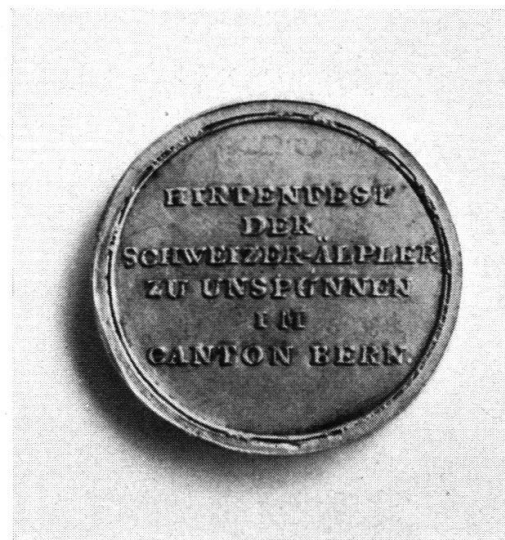
Medaille zur Auszeichnung der Sieger. Original im Historischen Museum Bern.