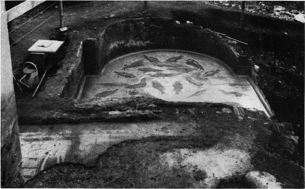
Römisches Badebecken mit Fischmosaik. Halbkreisförmige Abschränkung, seltenes Vorkommnis; Wasserausguß rechts.