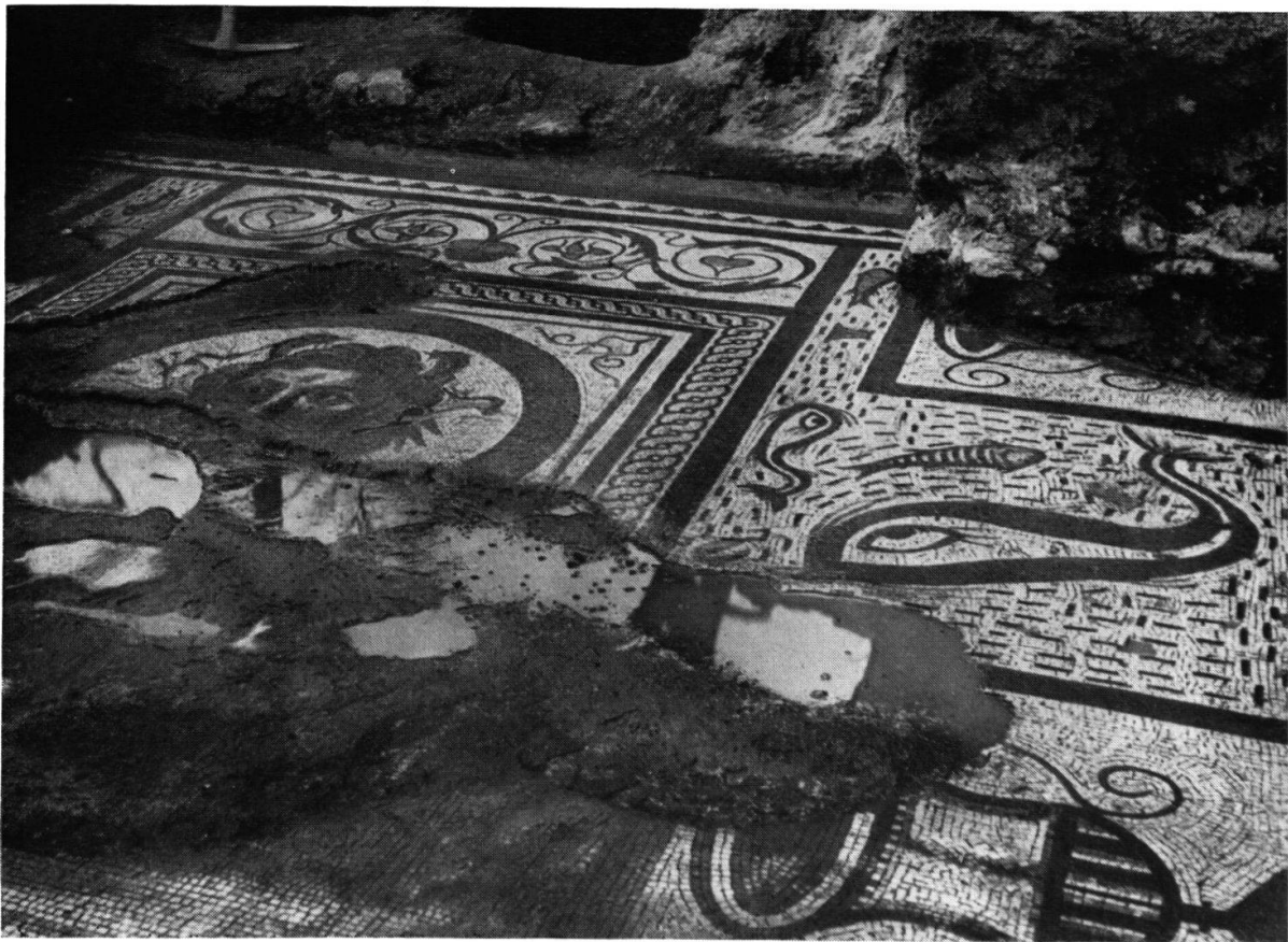
Römischer Mosaik mit Götterkopf im Mittelfeld, dessen Medaillon aus erhöhten Steinchen besteht. Nebenfelder mit Mischkrügen und Delphinen. (Norden →)