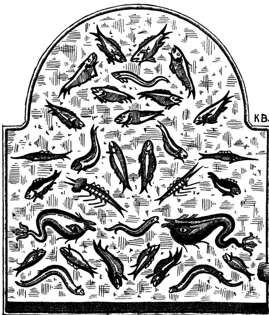
Römisches Badebecken mit Fischmosaik. (Norden →)

Notiz, «um Münsingen ist ein altes Wesen und es ist dort eine größere Stadt gestanden, als die hiesige (Bern). Sie sind zu gleicher Zeit, wie Wiflisburg und andere, zerstört worden», gewinnt dadurch seltsam an Bedeutung 3 . Unsere alten Chronisten haben aus der Ortsüberlieferung manchen wertvollen Hinweis geschöpft und gerettet. Ähnliche Badeanlagen haben sich 1930 in Üten- dorf (Amt Seftigen) und Vicques (Amt Delsberg) 1935—1937 gefunden. Alle diese Bäder gehörten zu schloßartigen Gutshöfen, deren Einkünfte meist auf Ackerbau und Viehzucht beruhten, im letztern Falle vielleicht auf Eisen- ausbeutung.