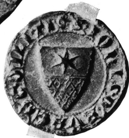
Der Stern von Bubenberg