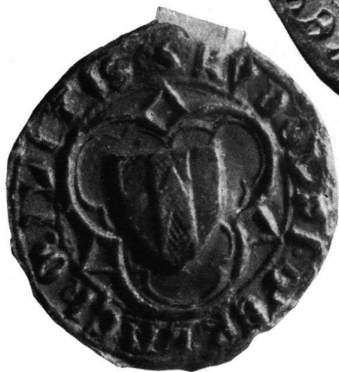
Rudolf von Erlach