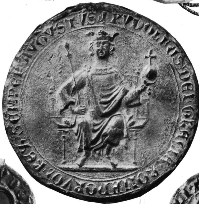
König Rudolf von Habsburg