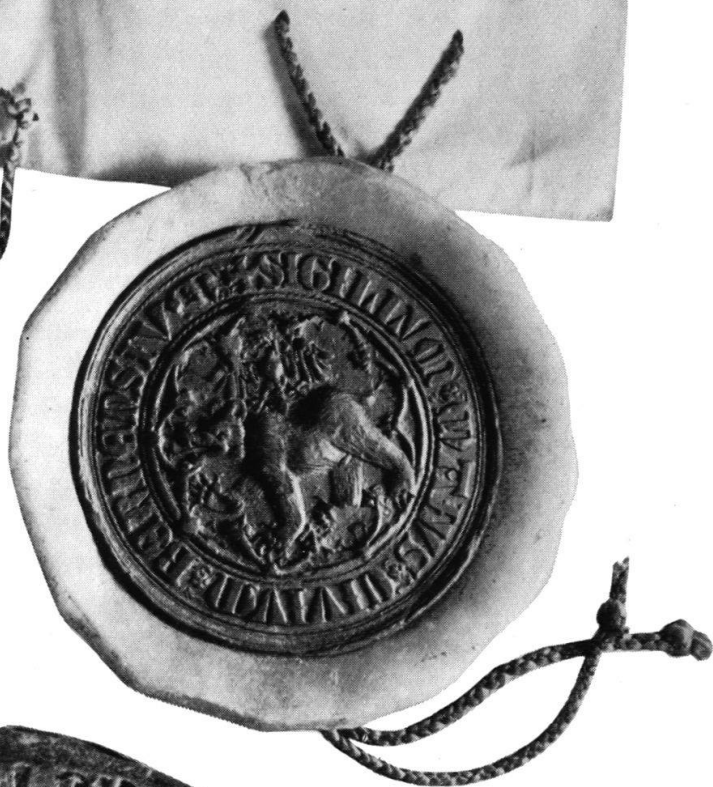
Berner Staatsiegel 1496