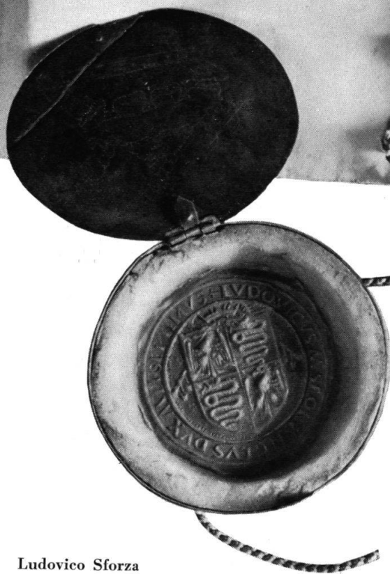
Ludovico Sforza 1496