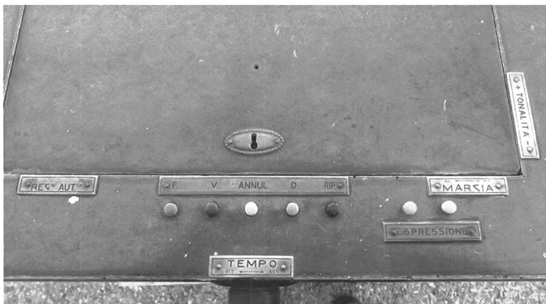
Figura 3: Auto-organo di Magliaso, dettaglio della parte superiore con il coperchio del lettore di rulli chiuso.

Barbieri dotò il suo apparecchio di accorgimenti che ne rendessero l'uso molto flessibile durante le funzioni liturgiche: sulla parte superiore (v. Figura 3) sono presenti vari comandi (registrazione automatica, annullatore, tempo, espressione, marcia, tonalità), grazie ai quali l'utilizzatore, organista o amatore, poteva, ad esempio, annullare la registrazione originale del rullo e fornirgliene una propria. L'operatore poteva inoltre intervenire su registri, velocità e tonalità, per adattare le musiche sacre al canto dei fedeli, secondo i propri orecchio, gusto e sensibilità. Questi comandi dimostrano che il detrattore Virgilio Molfino non conosceva il funzionamento dell'apparecchio, quando scriveva che il «coro canterà in un tono, e l'auto-organo risponderà in un altro»: in realtà era possibile adattare ad orecchio il tono dell'organo a canne a quello del coro, esattamente come era solito fare l'organista umano.