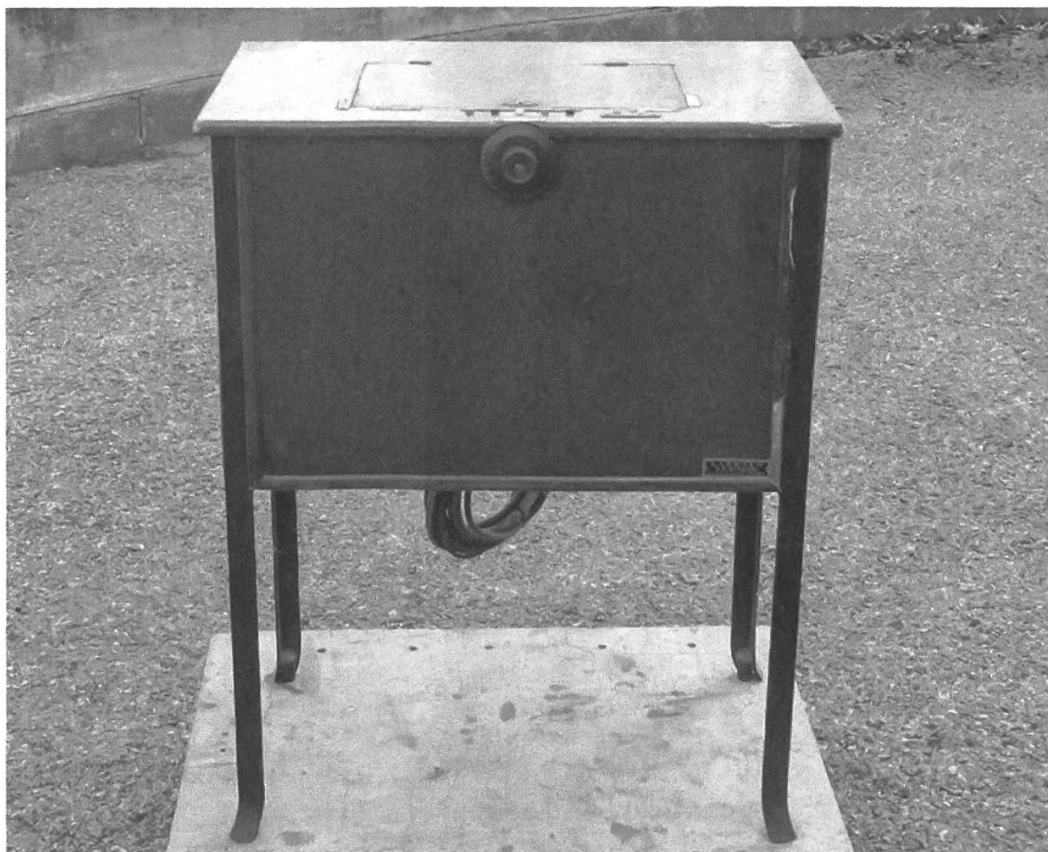
Figura 2: Auto-organo Barbieri che fu installato nella chiesa di San Biagio di Magliaso, Canton Ticino, alla fine del 1932.