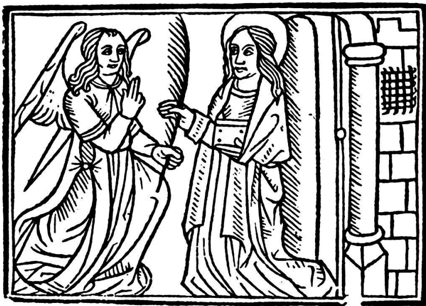
Constitutions de 1494, v o du feuillet du titre.

Incipiunt cōstitutiones synodales ecclesie z Episcopatus Lausannēsis. Per plures z diuer sos presules lausannēsis edite. Et per reuerēn. in cristo patrē dominum Georgium de salucijs Ep̄m et comitē Lausannēsis cōpilat et in vñū volumen redacte. et demū. Per reuerēdissimūz In xpo prēm z dominū. Dñm Aymonē de mō te falcone dei gr̄a. presulem principē et comitez lausannēn. modernū cōfirmate et approbate. Ac de eius mādato impresse.