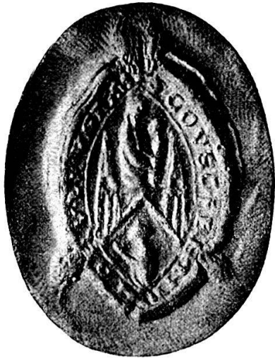
Sceau du couvent de Saint-François à Lausanne, en 1280.