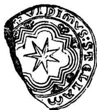
(Fig. 3.) CONTRE-SCEAU DE HUGUES DE CURSIS

STELLAM..... qui doit se lire et se compléter ainsi : Vidimus stellam ejus in Oriente , selon la parole des rois mages, tirée de l'évangile selon Saint Mathieu, ch. II, v, 2, annonçant la triomphante nouvelle de la naissance à Bethléem de Notre-Seigneur Jésus-Christ.