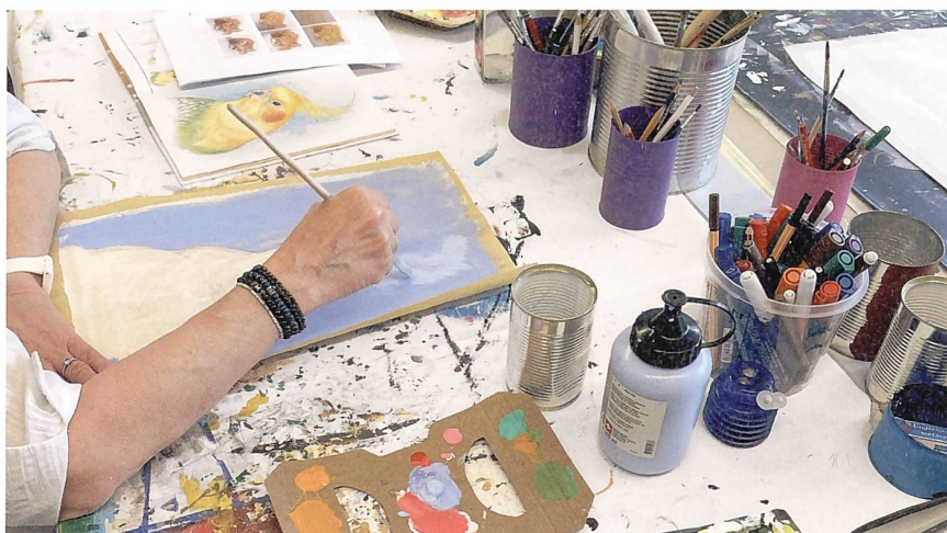
Malen sei wie meditieren, sagt eine Teilnehmerin der stiftungsinternen Tagesstätte.