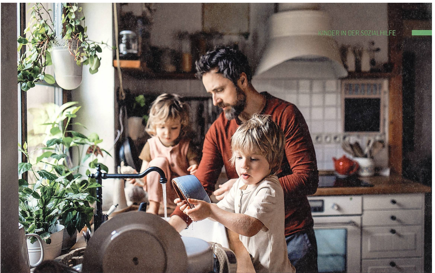
Von prekären Risikosituationen sind vor allem Familien mit Kleinkindern im Alter von null bis drei Jahren betroffen.

von null bis drei Jahren (19,9 Prozent). Alleinerziehende mit minderjährigen Kindern haben mit 34,5 Prozent das höchste Risiko, in Armut zu leben. Das Alter der Eltern spielt ebenfalls eine wichtige Rolle, wobei die Wahrscheinlichkeit, Sozialhilfe zu beziehen, höher ist, wenn die Eltern jünger sind.