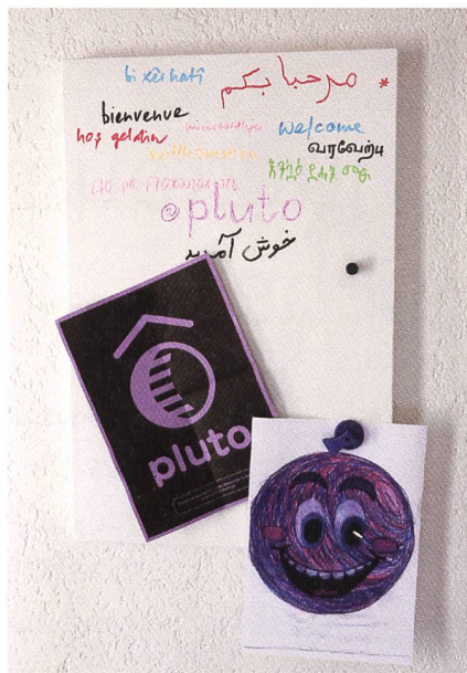
Willkommenstafel im Pluto mit Zeichnung. Denn so sieht pluto für eine Nutzerin aus, «etwas verwirrt, aber glücklich».

Das Anwaltschaftliche hat für Nici oberste Priorität: «Ich setze mich für die jungen Menschen ein, ich verurteile sie nicht.» Die Mitarbeitenden hören zu, beraten und begegnen den jungen Menschen auf Augenhöhe, sie tauchen in deren Lebenswelten ein und müssen keine angeordneten Massnahmen durchsetzen. «Das Angebot der Sozialberatung wird daher sehr häufig genutzt», weiss Nici. Oft suchen sich die jungen Menschen gezielt eine Bezugsperson aus, was die Pluto-Mitarbeitenden gerne zulassen. Sie können auch eigene Erfahrungen einbringen. Es erweise sich als hilfreich, über gemeinsame Erfahrungen zu sprechen, so wirkten die Sozialarbeitenden nicht wie Übermensen, sondern seien als Persönlichkeiten spürbar. «Wir haben keine Erwartungen an die jungen Menschen, was uns ermöglicht, ihnen unvoreingenommen und wohlwollend zu begegnen», erklärt Nici. Mätthu betont, wie wichtig die Kommunikation mit den jungen Menschen sei. Es sei jedoch schwierig für Jugendliche, mit jemandem im Wissen zu sprechen, dass diese Person dann allenfalls sanktionieren müsse. «Da sagst du lieber nichts», weiss Mätthu aus eigener Erfahrung aus seiner täglichen Arbeit einer sozialpädagogischen Einrichtung. Da brauche es ein Weiterdenken in den Institutionen, damit diese Problematik erkannt werde, meint er.