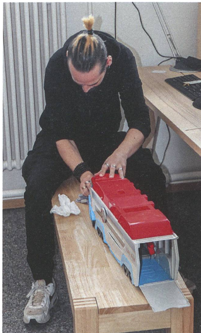
Alle Artikel werden bei Eingang auf Funktionalität und auf Schäden geprüft sowie gereinigt.

Heute steht neben dem Tagesgeschäft auch noch eine Putzaktion auf dem Plan. Zwei Frauen sind gerade dabei, die Fenster zu reinigen. Es herrscht emsiges Treiben, das Putzen der Scheiben verursacht ein Quietschen, «schlimmer als Nägel auf der