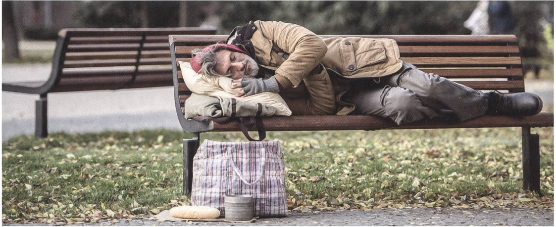
Die Schweiz anerkennt in der Bundesverfassung zwar das Grundrecht auf Hilfe in Notlagen, ein justiziables Recht auf eine angemessene Wohnung ist jedoch nicht vorgesehen.

lung von wirksamen Methoden zur Prävention und Abwendung von Obdachlosigkeit und drohender Wohnungslosigkeit. Insgesamt fällt bei der Befragung der Kantonsvertretenden auf, dass diverse staatliche Aufgaben im Bereich der sozialen Sicherheit in der operativen Zuständigkeit der Gemeinden gesehen werden.