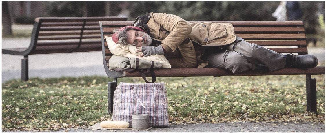
Die Schweiz anerkennt in der Bundesverfassung zwar das Grundrecht auf Hilfe in Notlagen, ein justiziables Recht auf eine angemessene Wohnung ist jedoch nicht vorgesehen.

lung von wirksamen Methoden zur Prävention und Abwendung von Obdachlosigkeit und drohender Wohnungslosigkeit. Insgesamt fällt bei der Befragung der Kantonsvertretenden auf, dass diverse staatliche Aufgaben im Bereich der sozialen Sicherheit in der operativen Zuständigkeit der Gemeinden gesehen werden.