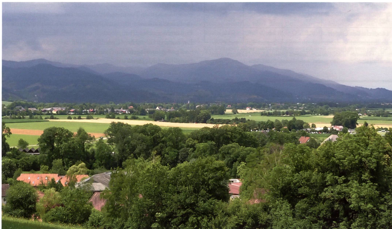
In der dörflichen Gemeinschaft funktioniert die gegenseitige Unterstützung häufig noch.