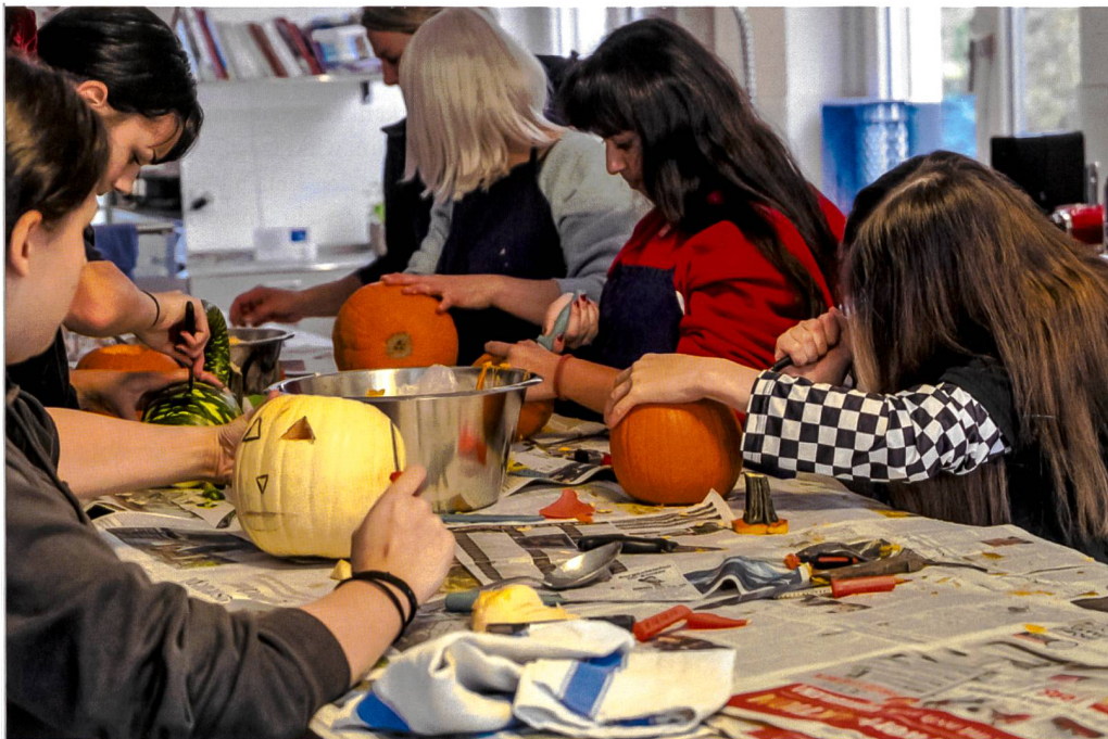
Gemeinsame Aktivitäten sorgen für eine tragende Struktur.