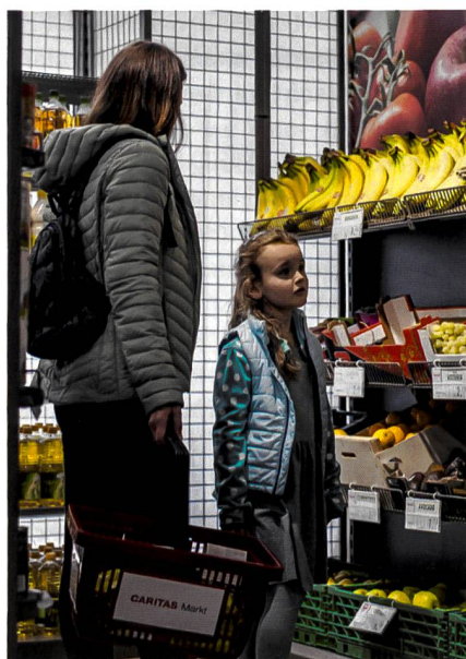
Viele Haushalte leben nur knapp über der Armutsgrenze.

Knapp 9 Prozent der Baselbieter Bevölkerung sind gemäss Zahlen aus dem Jahr 2017 von Armut betroffen – rund 15 Prozent sind armutsgefährdet. Es gebe keine Hinweise darauf, dass die Armut im Kanton Basel-Landschaft zurückgegangen sei, vielmehr habe sie eher zugenommen, sagte Jörg Dittmann von der Hochschule für Soziale Arbeit der FHNW, der den Armutsbericht im Auftrag des Kantons Basel-Landschaft verfasst hat. (ih)