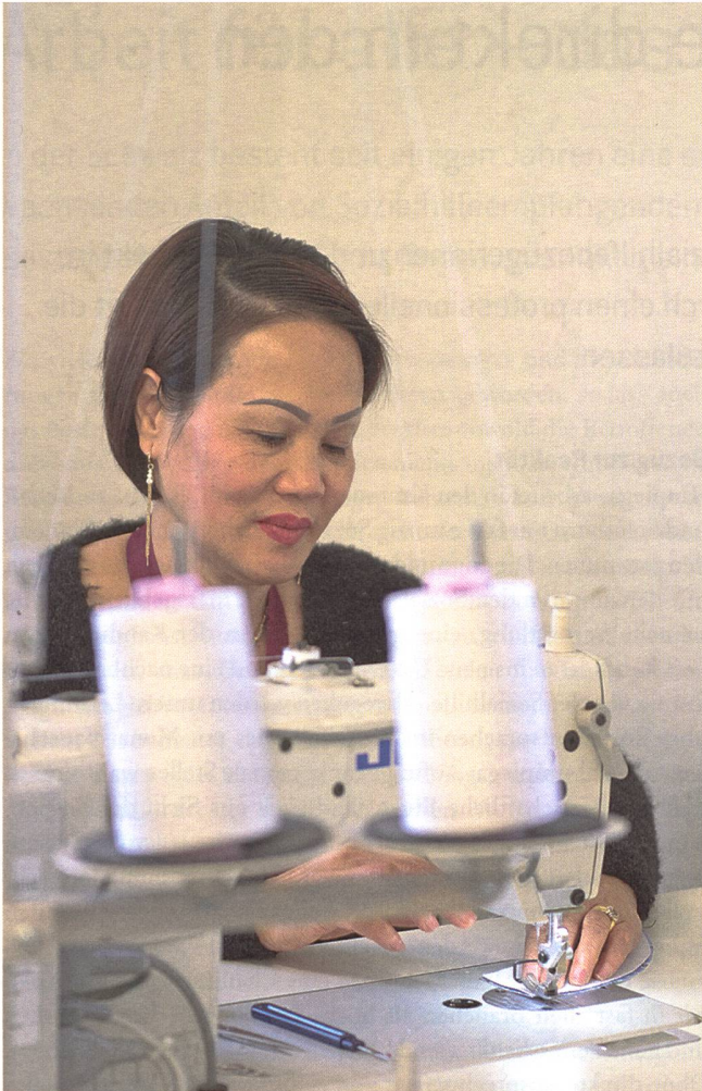
In der Sozialfirma laufen mehrere Fäden zusammen.

kennen wir ihre Wirkungsweise. Folgendes Beispiel beschreibt das Zusammenspiel der Faktoren aus der Perspektive der Klientinnen und Klienten (siehe untenstehende Grafik):