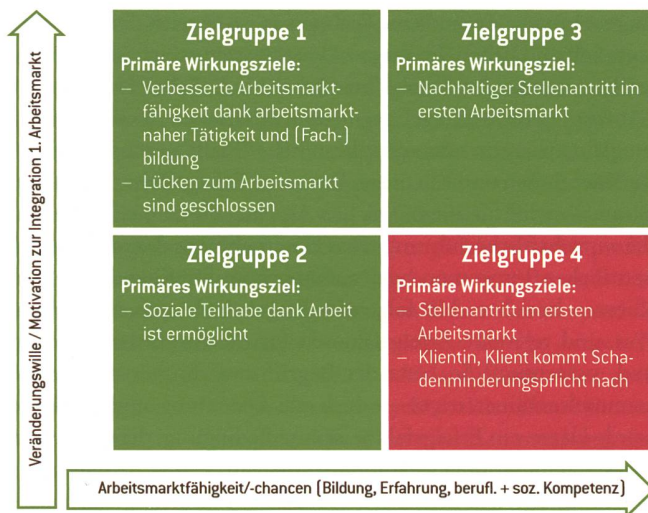
Motivation und Arbeitsmarktchancen entscheiden über die Zuteilung zu den Zielgruppen.

Menschen mit einem kleinen Bildungsrucksack haben es zunehmend schwer, einen Arbeitsplatz zu finden. Diese Entwicklung stellt die Sozialsysteme vor grosse Herausforderungen. Langfristig lassen sich die beruflichen Chancen für Geringqualifizierte nur über Qualifizierung erreichen – innerhalb wie ausserhalb der Sozialhilfe. Zürich vollzieht derzeit in der Sozialhilfe einen Paradigmenwechsel von der Sanktionierung und Verpflichtung hin zur Motivation und Befähigung. Basis dieser neuen Strategie ist die Erkenntnis, dass man Qualifizierungsmassnahmen nicht über Zwang verordnen kann. Lernerfolg und berufliche Weiterentwicklung sind ohne Motivation und Wille nicht möglich. So werden Sozialhilfebeziehende neu in vier verschiedene Gruppen eingeteilt. Die Zuteilung erfolgt nach der individuellen Ausprägung der beiden Dimensionen «Arbeitsmarktfähigkeit/-chancen» und «Veränderungswille/Motivation». Je nach Zielgruppe gibt es unterschiedliche Wirkungsziele. Die Einteilung in eine der vier Gruppen erfolgt nach der Absolvierung des vierwöchigen obligatorischen Arbeitseinsatzes in der Basisbeschäftigung der Sozialen Einrichtungen und Betriebe der Stadt Zürich.