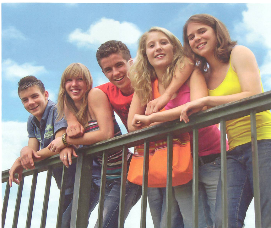
Jugendliche sollen selbstsicher, sozialkompetent, gesund sein, sich wohl fühlen und sich aktiv und partnerschaftlich an der Gemeinschaft beteiligen.

Die ZESO bietet ihren Partnerorganisationen diese Rubrik als Plattform an, auf der sie sich und ihre Tätigkeit vorstellen können: in dieser Ausgabe dem Dachverband Offene Kinder- und Jugendarbeit Schweiz (DOJ).