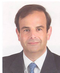
Gerhard Pfister, Nationalrat (ZG), Präsident CVP Schweiz