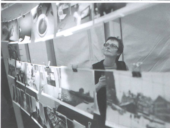
Die Sozialhilfe wird für Besucherinnen und Besucher fassbar.