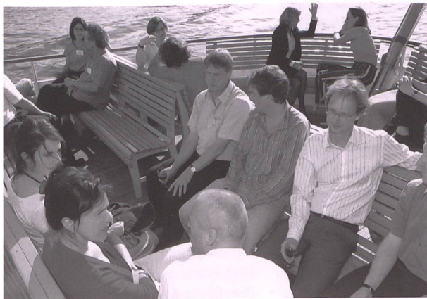
Feiern, reden, geniessen – SKOS-Mitglieder und geladene Gäste auf dem Vierwaldstättersee.