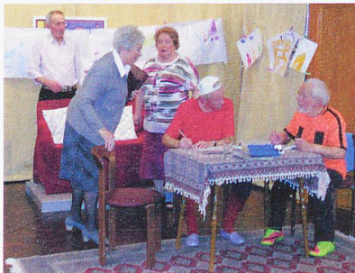
Seniorenbühne mit dem Stück «Herr Gottfried und Frau Stutz».