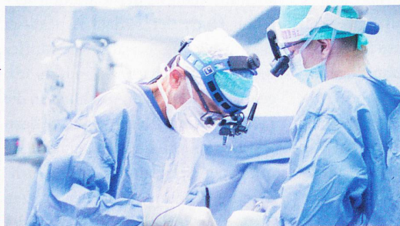
Xavier Mueller/Luzerner Kantonsspital

Ja, die gibt es. Ein Herzinfarkt ereignet sich eher selten wie ein Blitz aus heiterem Himmel. Oft deuten bereits vorher