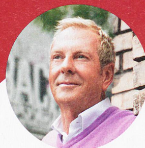
Moderation: Kurt Aeschbacher

Pro Senectute TALK – Vorabendveranstaltung