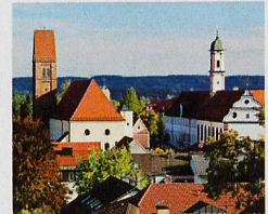
Oben: Ortsbild Bad Wörishofen Links: Aromagarten Bad Wörishofen

Im Programm neben Bad Wörishofen auch Abano-Montegrotto, Montecatini und Ischia. Fordern Sie den Stöcklin Katalog 2018 unverbindlich an!