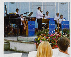
Oben: Das Kurorchester in Aktion Links: Der Rosengarten in voller Pracht

Stöcklin Katalog Im Programm neben Bad Wörishofen auch Abano-Montegrotto, Montecatini und Ischia. Fordern Sie den Stöcklin Katalog 2018 unverbindlich an!