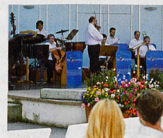
Oben: Das Kurorchester in Aktion Links: Der Rosengarten in voller Pracht

Stöcklin Katalog Im Programm neben Bad Wörishofen auch Abano-Montegrotto, Montecatini und Ischia. Fordern Sie den Stöcklin Katalog 2018 unverbindlich an!