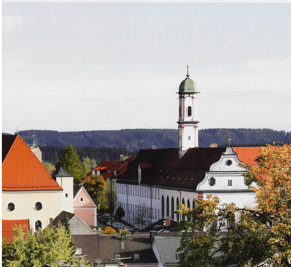
Das Dorfbild von Bad Wörishofen, der Wirkungsstätte des berühmten Pfarrer Kneipp