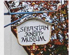
Oben: Sebastian Kneipps Lebenswerk im ortseigenen Museum Links: Kneipp-Armbad

Im Programm neben Bad Wörishofen auch Abano-Montegrotto, Montecatini und Ischia. Fordern Sie den Stöcklin Katalog 2017 unverbindlich an!