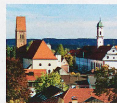
Oben: Ortsbild Bad Wörishofen

Im Programm neben Bad Wörishofen auch Abano-Montegrotto, Montecatini und Ischia. Fordern Sie den Stöcklin Katalog 2017 unverbindlich an!