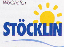
Links: Aromagarten Bad Wörishofen

Stöcklin Reisen AG Dorfstrasse 49 CH-5430 Wettingen Tel. 056 437 29 29 www.stoecklin.ch , info@stoecklin.ch