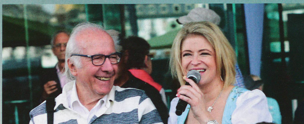
Schlagersängerin Monique animiert die Gäste zum Mitsingen.