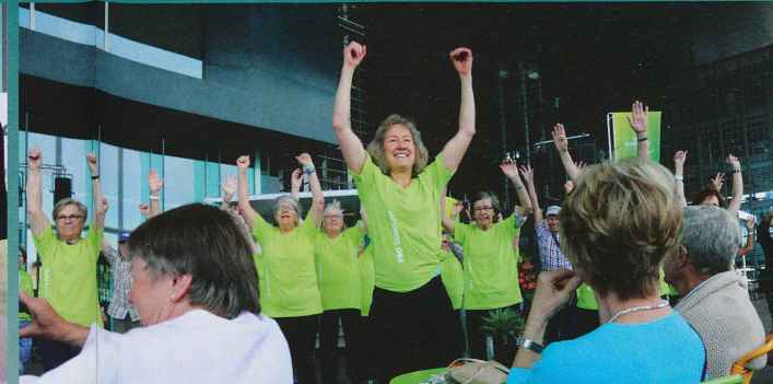
Aufforderung zum Mitmachen mit der bfu-Kampagne «Sicher stehen – sicher gehen.»