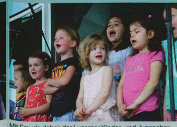
Mit Freude dabei: der Luzerner Kinder- und Jugendchor St. Anton/St. Michael.