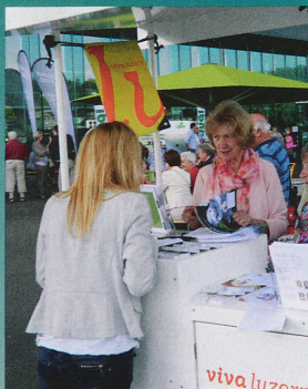
Die viva-Mitarbeiterin gibt Auskunft.