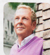
Kurt Aeschbacher Moderation

Rahmenprogramm: Dirty Hands, Breakdance Gruppe