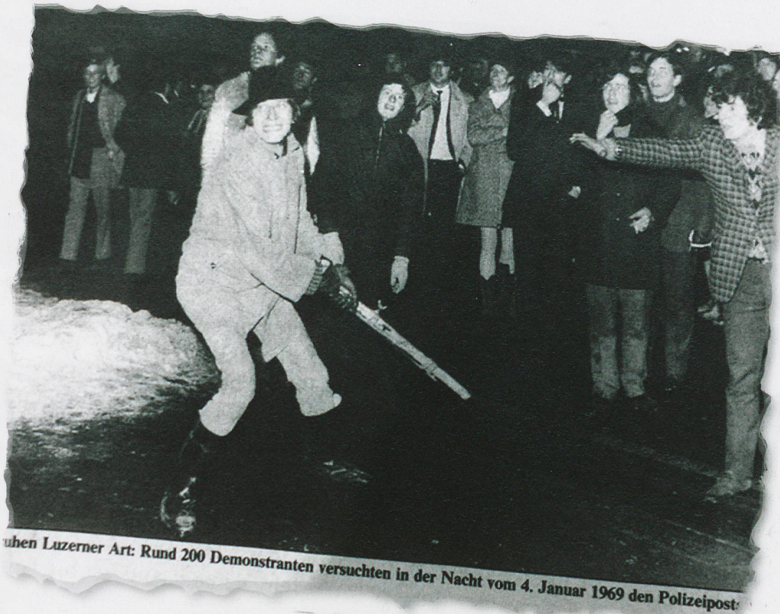
Mit einer provinziellen Verspätung von einem Jahr erlebte Luzern am 4. Januar 1969 eine Krawallnacht: 200 Demonstranten belagerten und beschädigten den Polizeiposten der Stadtpolizei.