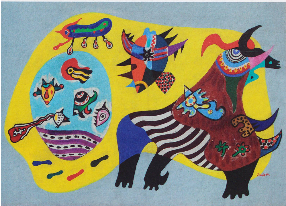
Sonja Sekula, «Animal Without Subject of War», 1944, Öl auf Leinwand, Kunstmuseum Luzern.