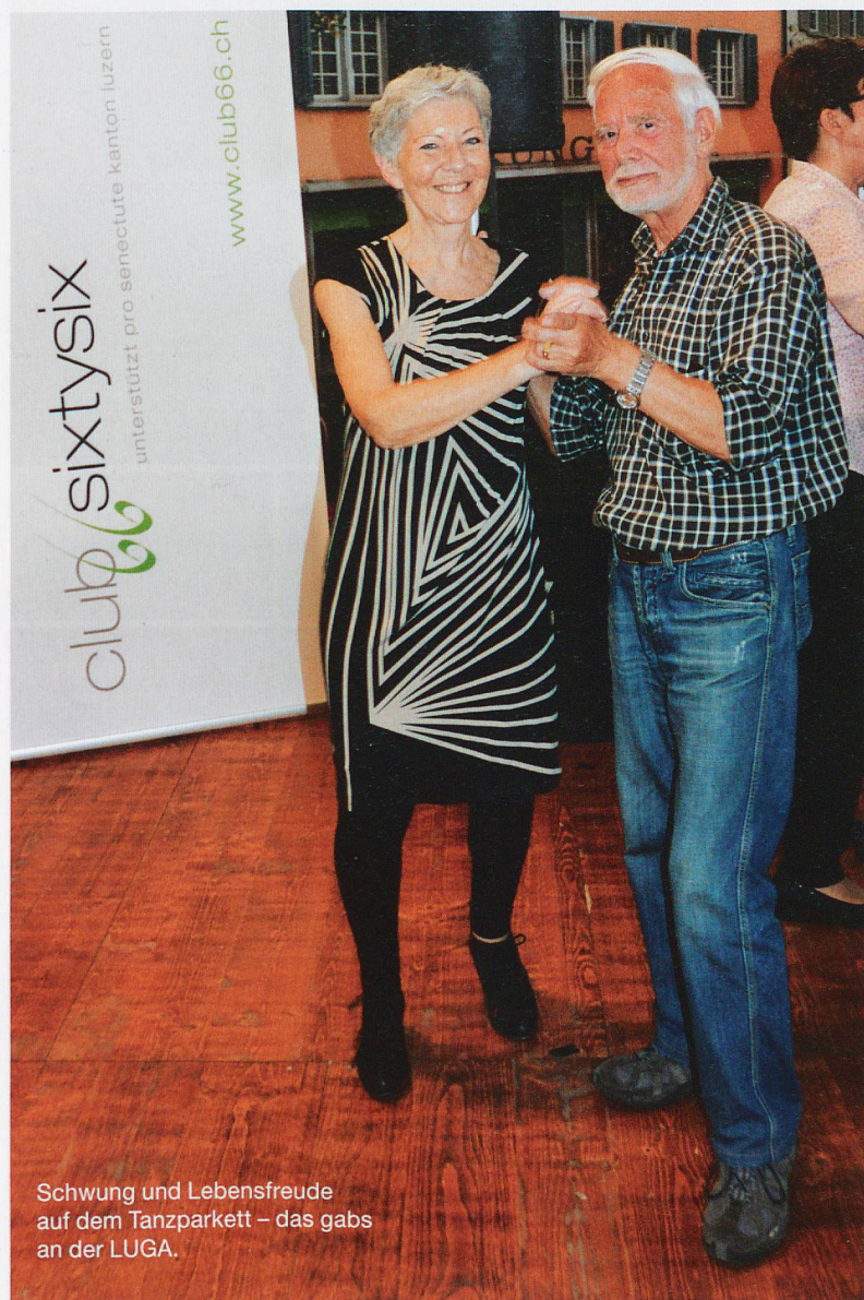
Schwung und Lebensfreude auf dem Tanzparkett – das gabs an der LUGA.

Interessante Referate und wertvolle Begegnungen: Das gabs an den Impulsnachmittagen sowie am Tanznachmittag und am Stand von Pro Senectute anlässlich der LUGA.